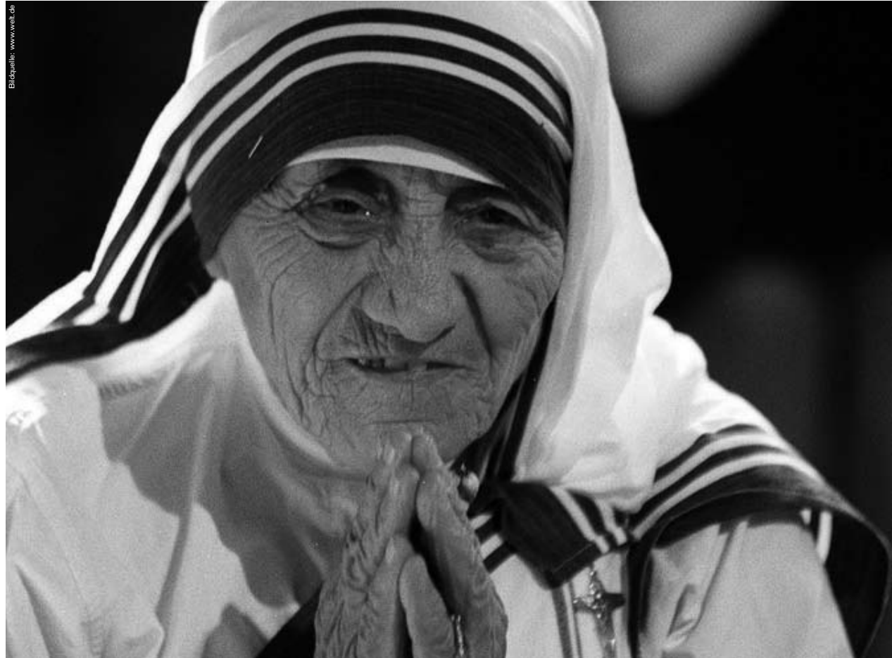
Mutter Theresa: «Wer seine Mitmenschen kritisiert, hat keine Zeit sie zu lieben.»