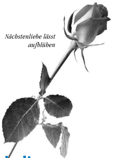
Nächstenliebe lässt aufblühen