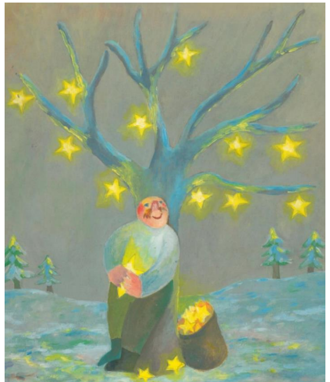
Der Sternbaum. NordSüd Verlag [2020]. ISBN [978-3-314-10546-3]

Infos zur Fotostory und zum Hörspiel «So ein Kamel» unter www.rez.ch .