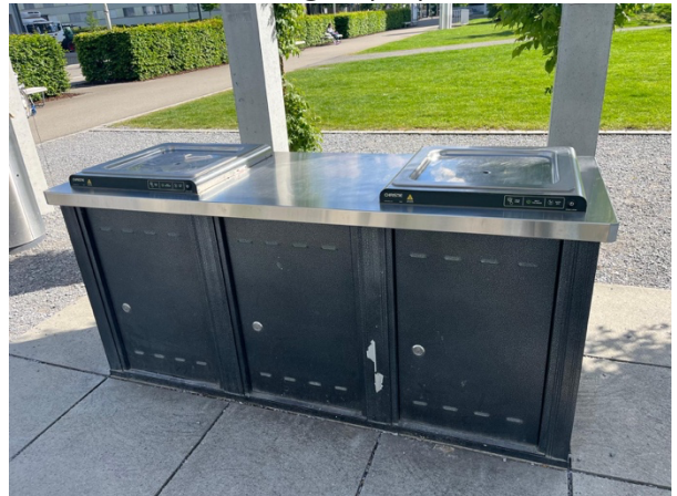
öffentlicher Elektrogrill (rot)