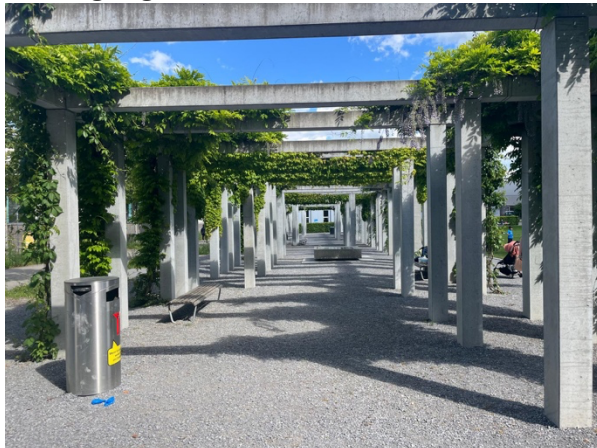
> Bereich für Festbankgarnituren