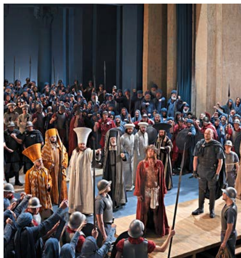
Szene aus dem Passionsspiel