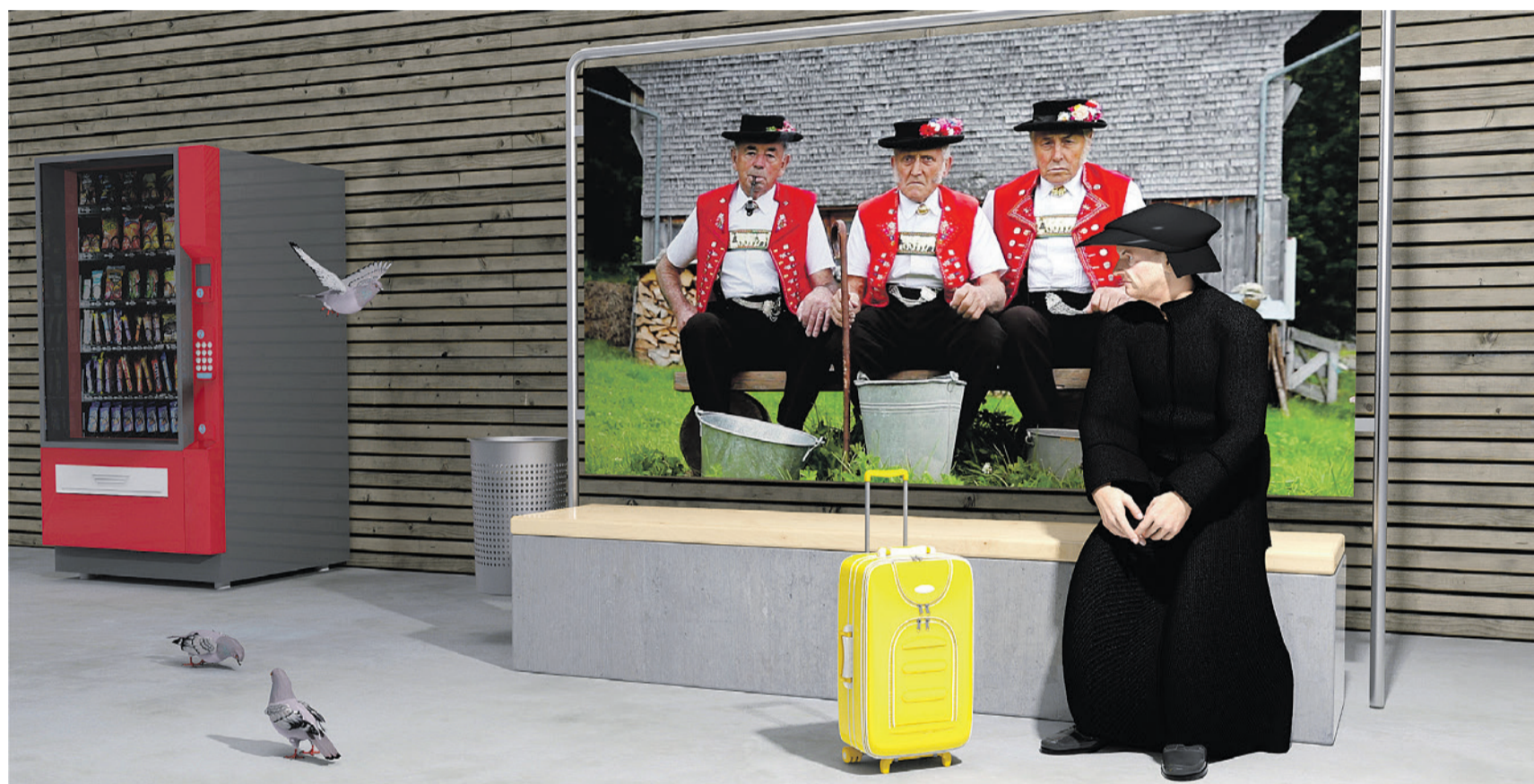
Mit Zwingli auf Reisen zu gehen, ist hoch spannend.

Die südafrikanische Studentin schaute mich mit weitaufgerissenen Augen an. Ich hatte dort an der Universität von Pretoria erzählt, dass unter Zwinglis Einfluss die Zwangsehe verboten und das heiratsfähige Alter für Frauen auf 19 Jahre hochgesetzt wurde.