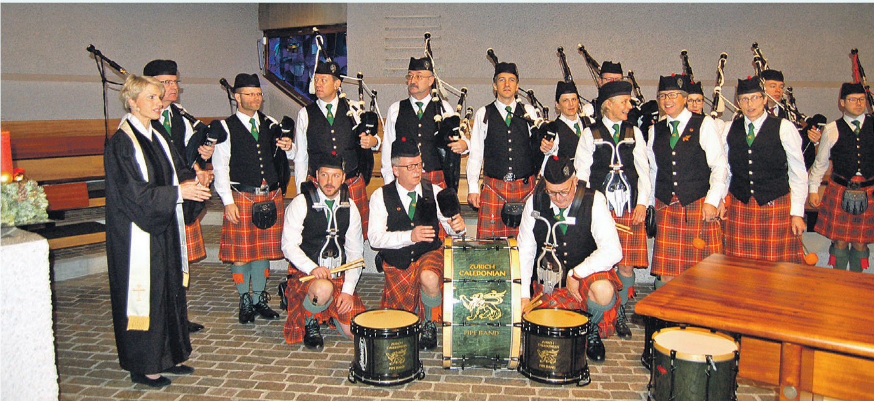
Musik-Gottesdienst zum Jahresende mit der Zurich Caledonian Pipe Band und Orgel.