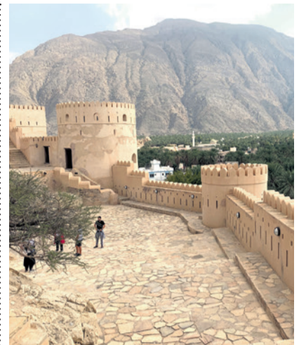
Oman: Land zwischen Orient und Okzident!

Wie will man sich dem Oman annähern? Soll man von seiner Kultur berichten? Oder von seiner langen Jahrtausende alten Geschichte erzählen? Soll man den Oman näherbringen, indem man von den äusserst gastfreundlichen Menschen berichtet? Von der feinen multikulturellen Küche schwärmen? Oder soll man das riesige Land zwischen Saudi-Arabien und Jemen geografisch erklären? Soll man die riesi-