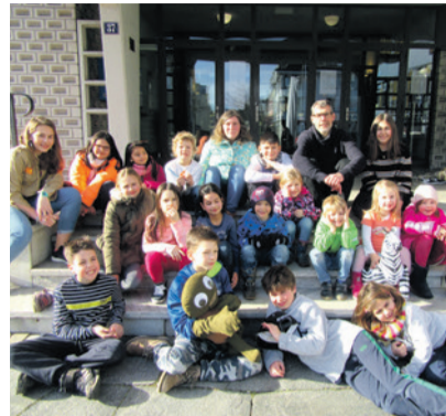
Zufriedene Kinder, die mit Kiki auf Weltreise waren.