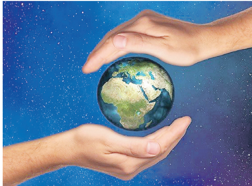
Im März wird der neue Dokumentarfilm «Der Konzern-Report» (40', 2020) veröffentlicht.

Die Konzernverantwortungsinitiative (KOVI) vertritt ganz klar Anliegen der Kirche. Sie gründet auf zwei zentralen Anliegen der biblischen Botschaft und des christlichen Glaubens: Bewahrung der Schöpfung und Nächstenliebe. Bei den Propheten, bei Jesus und den Aposteln wird Seite für Seite betont, dass sich Gott für die Unterdrückten stark macht und Gerechtigkeit einfordert. Und uns alle macht Gott zu seinen Mitarbeiterinnen und Mitarbeitern. Folgende nationale kirchliche Gremi-