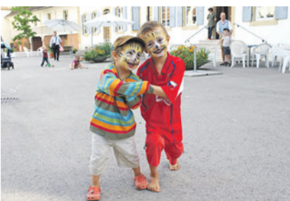
Die Ferienwoche in Montmirail verspricht viel Spass.

Eingeladen sind Einzelpersonen, Paare und Familien aller Altersgruppen und Jugendliche ab der 5. Klasse. Für Erwachsene, Teenies und Kinder wird ein separa-