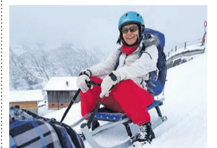
Hanna in Fahrt!