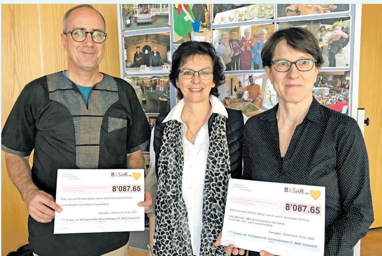
Erfolgreicher Basar 2019: Good Hearts Organisation und SBS Schweiz. Bibliothek für Blinde, Seh- und Lesebehinderte durften je einen Check von Fr. 8087.65 entgegennehmen.