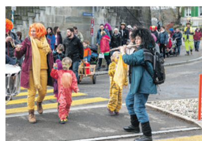
Gelungene Fasnachtsfeier in der Kirche Schwerzenbach mit anschliessendem Umzug ins Pfarreizentrum St. Gabriel.

Verkleidet besammelten wir uns in der reformierten Kirche und hörten die Geschichte von Elmar, dem farbigen Elefanten: Damit er nicht immer als Einziger anders ist, malen sich die anderen Elefanten einmal im Jahr farbig an. Sie feiern Elefantenfasnacht. Für den anschliessenden Fasnachtsumzug bastelten wir uns eine Rassel aus Kartonrollen und Kichererbsen. Nach Liedern, Gebet und Segen ging es los. Zusammen mit Trommeln, Saxofon, Trompete, Querflöte und unseren Rasseln zogen wir im Sonnenschein laut und hörbar von der reformierten Kirche dem Chimplibach entlang zum Tennisclub. Dort fand auf dessen Parkplatz die grosse Konfettischlacht statt: Konfetti in allen Farben, überall, auf allen Köpfen glitzerten die farbigen Konfetti. Zum Abschluss verpflegten wir uns beim katholischen Pfarreizentrum St. Gabriel mit Hotdog, Suppe und Punsch und genossen das friedliche Zusammensein. Wir danken den Musikerinnen und Musikern und allen Helferinnen und Helfern, die diesen gelungenen Anlass ermöglichten – und freuen uns schon auf die Fasnachtsfeier im nächsten Jahr!