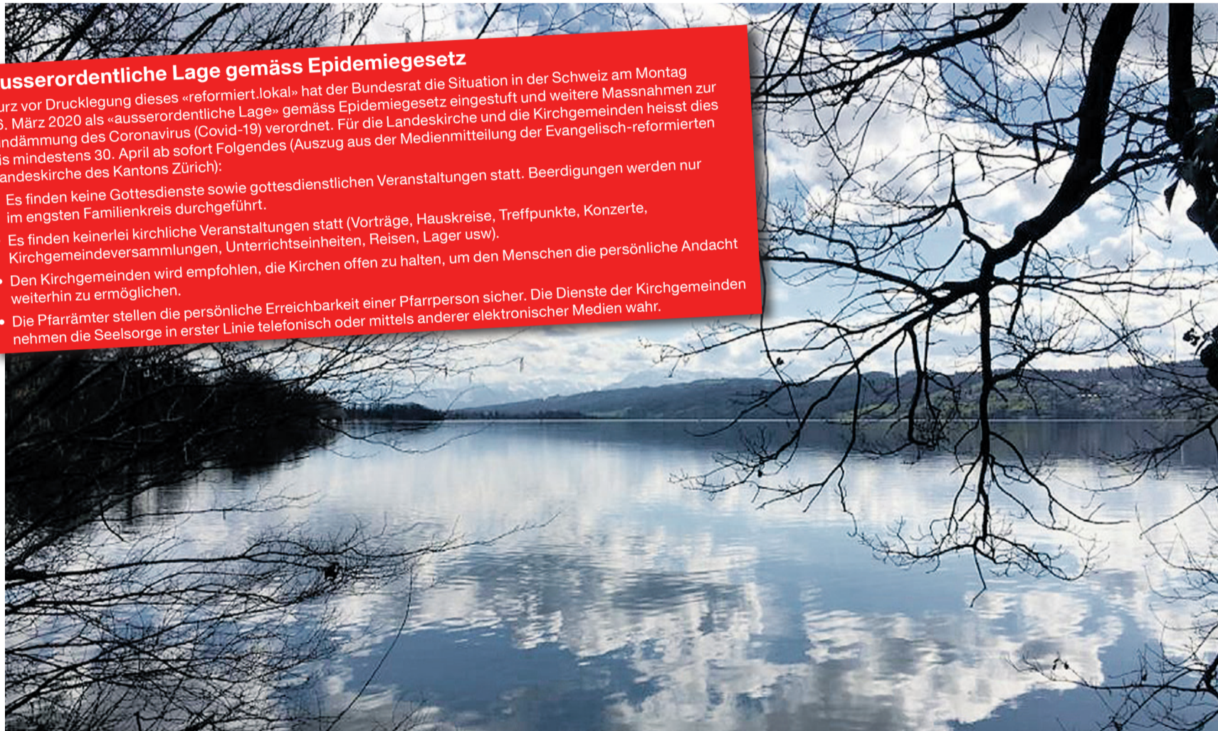
Hallwilersee im März