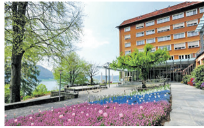
Hotel und Seminarzentrum Ländli in Oberägeri