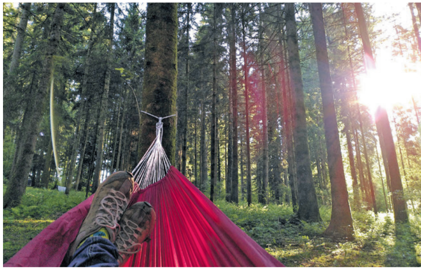
In der Hängematte am Waldplätzli

...han ich es Plätzli, wo mir gfallt», heisst es im bekannten Lied und ja, ich habe verschiedene Waldplätzli, die mir gut gefallen. Der Wald ist bei uns für die meisten ein Erholungsort, ein Plätzli zum Auftanken. Der Wald ist so viel mehr – ein komplexes Ökosystem mit einer unglaublichen Bedeutung und eine Artenvielfalt mit hohem Wert. Wälder filtern unser Trinkwasser, sie schützen vor Lawinen, liefern Holz für uns Menschen und sind Heimat von Tieren und Pflanzen. Die Vielfältigkeit des Waldes vom Boden bis zu den Baumkronen fasziniert und ist ein ideales Thema, sich vertieft damit zu beschäftigen. Nach dem Wasserthema des letzten Jahres, widmen sich das Umweltteam und alle, die mitmachen möchten, dem Thema Wald. Wie wär's mit einem Ausflug zum Urwald in der Schweiz oder einmal im Wald zu übernachten? Lassen wir uns überraschen! Oder was können wir tun, damit die Ressource Wald lange erhalten bleibt? Wir möchten