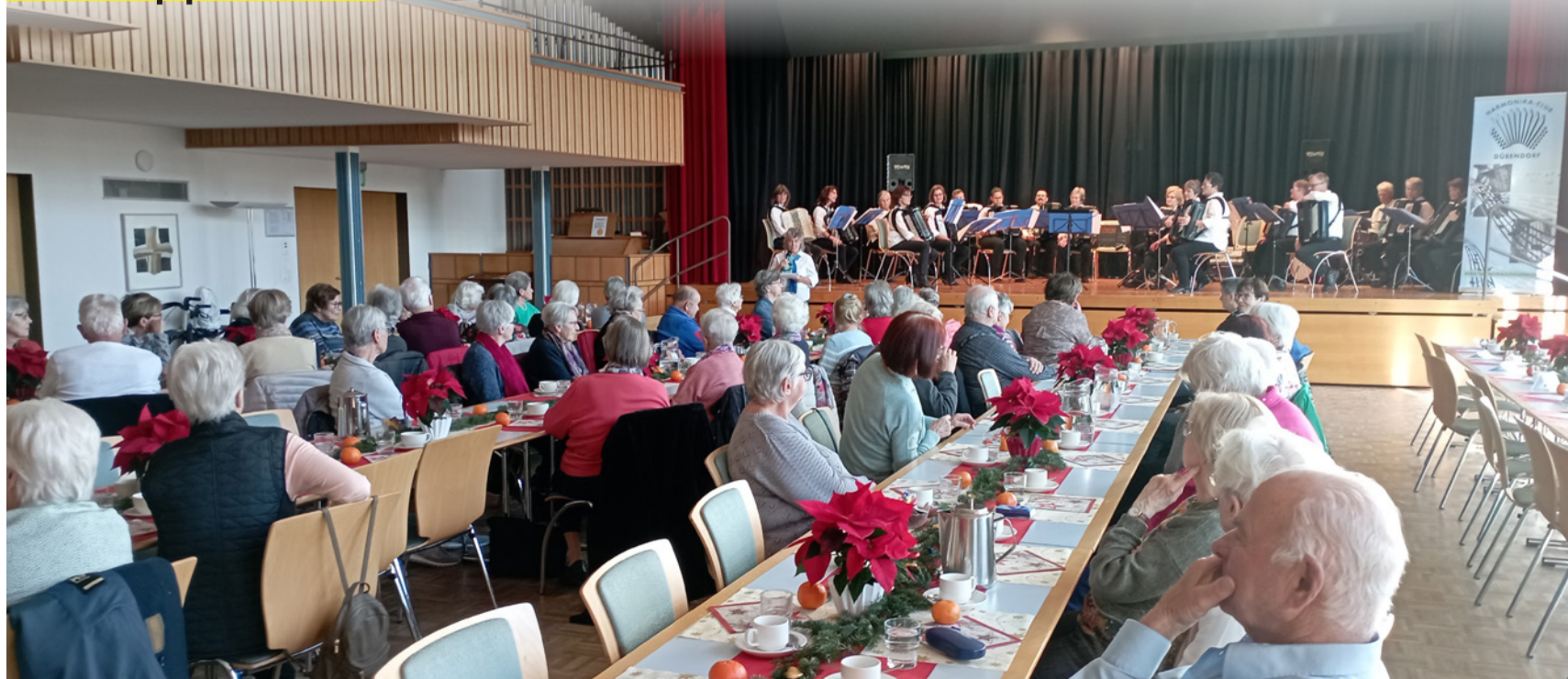
Auftritt des Harmonika-Clubs Dübendorf anlässlich der Senioren-Adventsfeier vom 6. Dezember 2022.