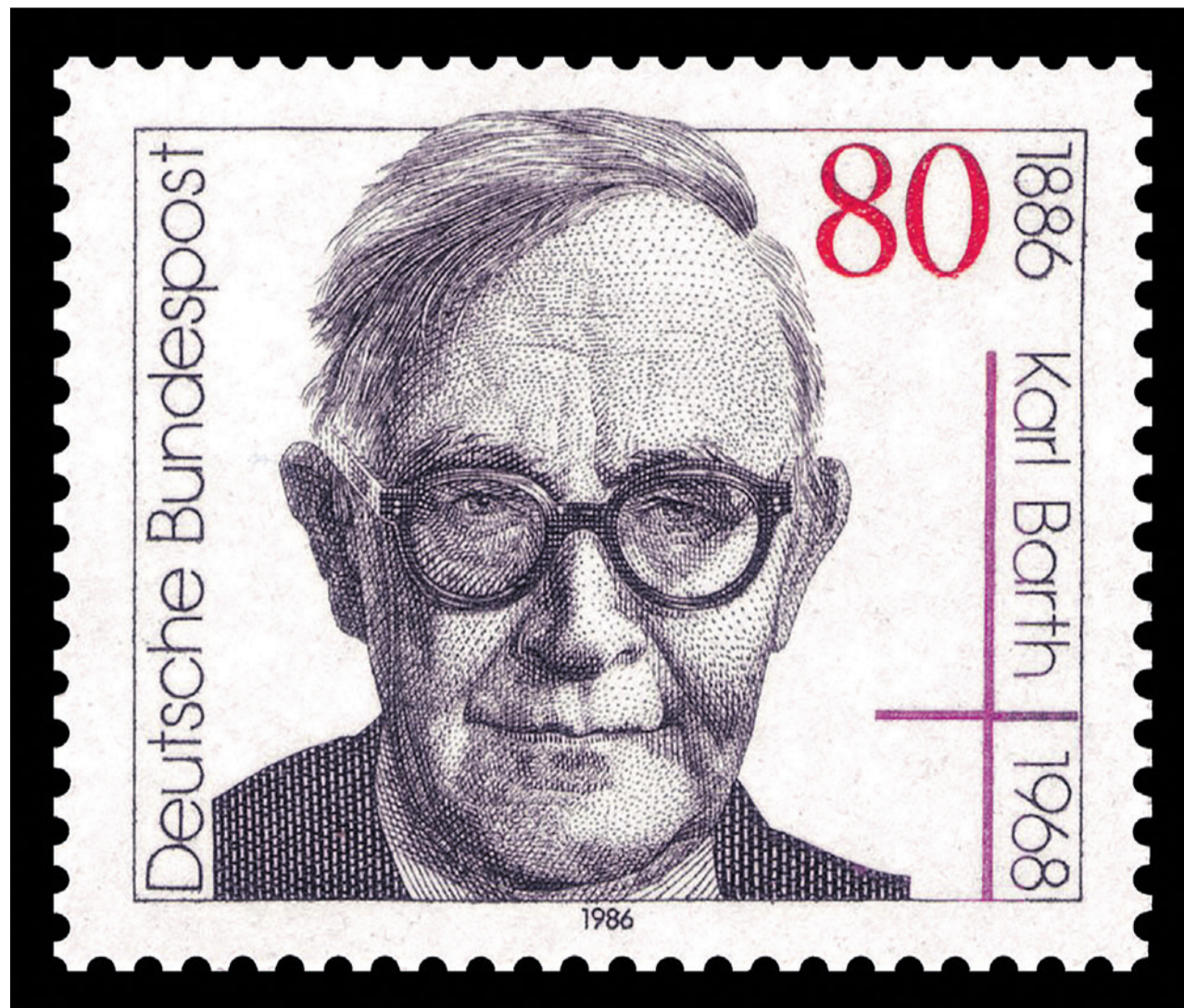
Karl Barth auf einer Briefmarke der Deutschen Bundespost (1986)