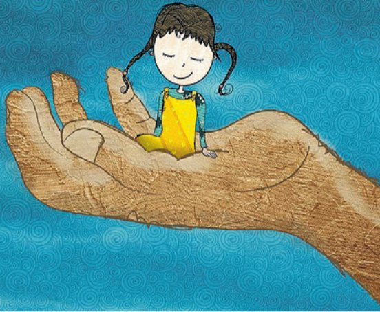
Von Gott beschützt. SCM R. Brockhaus (2021) ISBN (978-3-417-28913-8)

Gott wird in Gefahr bei dir sein und dich selbst in größter Not in seiner Hand halten.