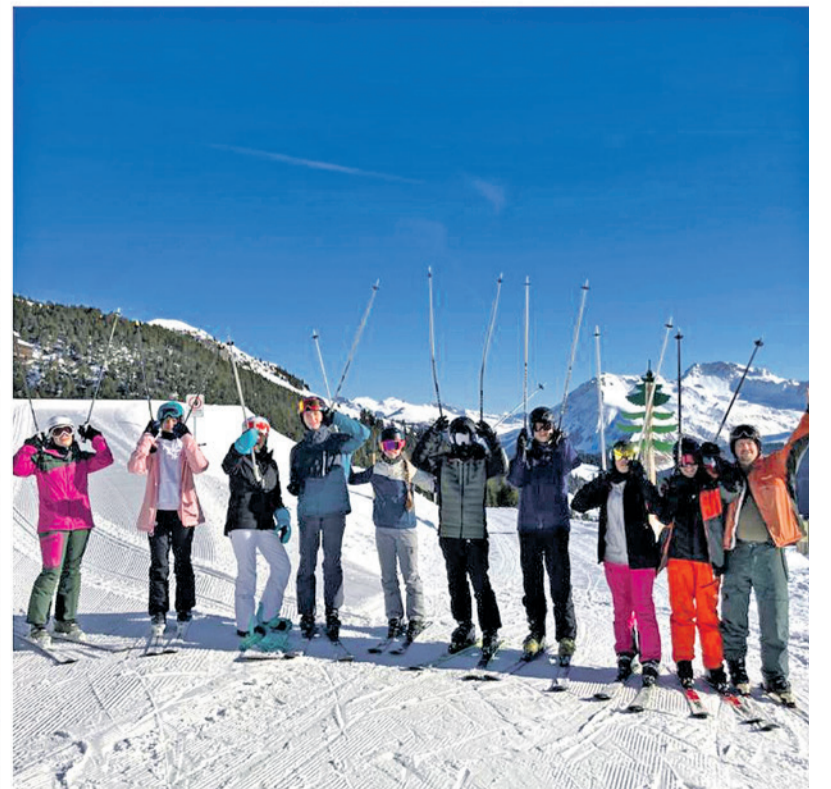
Die kleine Gruppe hatte viel Spass in Arosa.