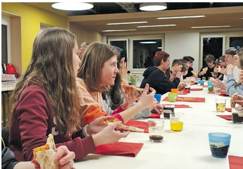
Gute Stimmung und fröhliche Gesichter beim 1. Pizza-Abig