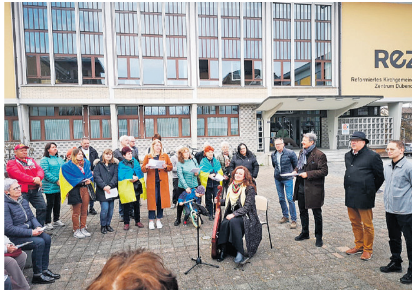
Gut besuchte Gedenkfeier am 24. September 2022

Helfen tat zwar gut, beiden Seiten, aber die Ohnmacht gegenüber dem, was dort im Kriegsgebiet geschah, blieb bestehen. Bei einem