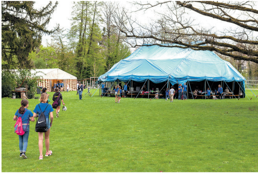
Das grosse EWO-Zelt auf der Badiwiese erwartet die Kinder.