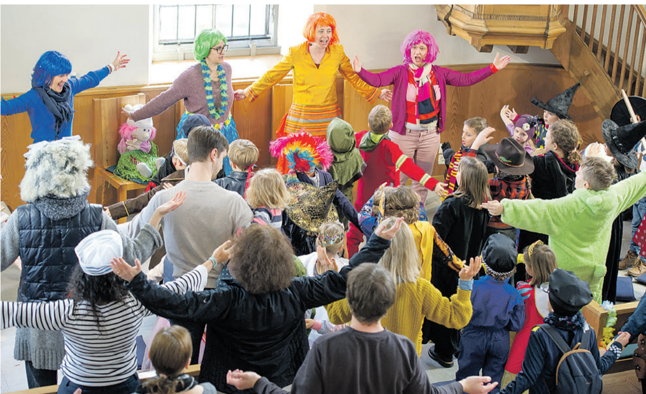
Fasnacht im Fiire mit de Chliine am 4. März 2023 in Schwerzenbach