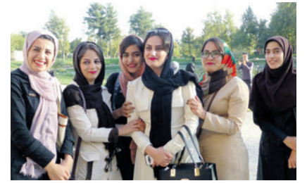
Das Land ist vielfältig und die Bevölkerung äusserst gastfreundlich.

Bei den gebildeten Iranern gibt es eine weitverbreitete Rückbesinnung auf die vorislamische Geschichte. Man ist sich bewusst, dass Persien vor 2500 Jahren eine religiös tolerante Weltmacht war und von Indien bis Libyen herrschte. Die Tatsache, dass der Shah an grossen Teilen der Bevölkerung vorbeigeregte und die Kultur und Religiosität seines Landes missachtete, rächte sich in der islamischen Re-