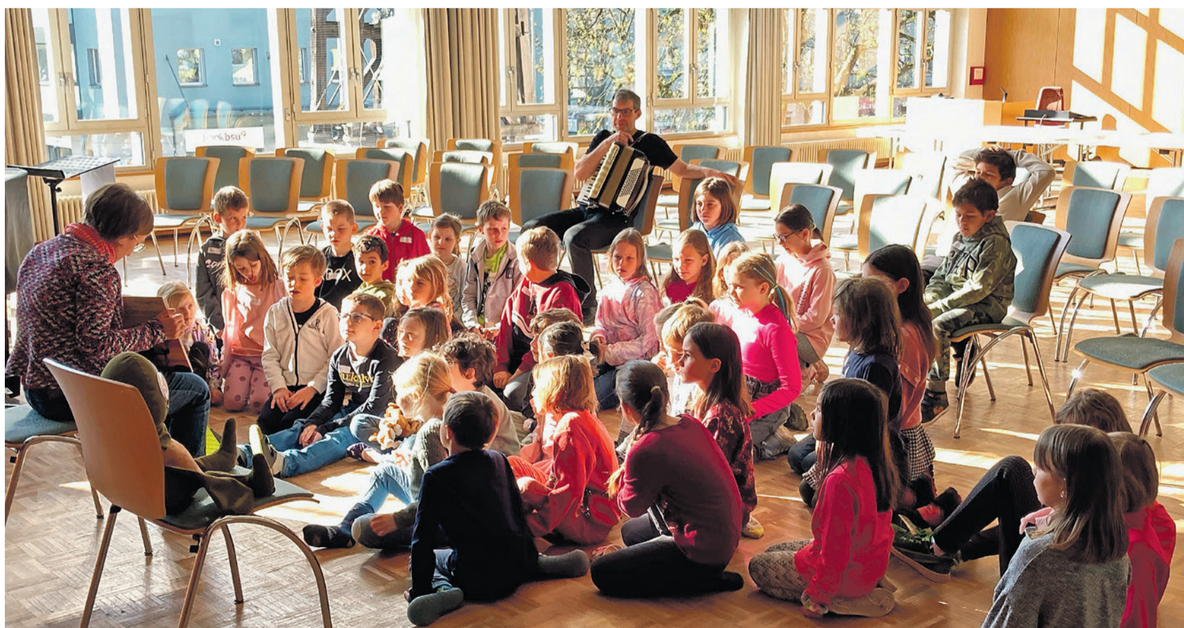
Die Kinder lauschen beim Kiki-Tag am Gründonnerstag, 6. April 2023 gespannt der Ostergeschichte.