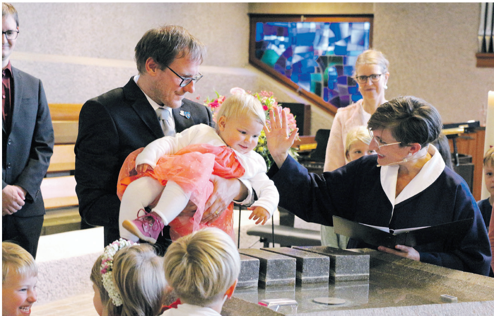
Taufe in der Kirche im Wil 2021

Die Dreieheit bildet ein Ganzes. An vielen Orten finden wir eine Trinität. Die christliche denkt Gott, Vater und Mutter, Jesus Christus, der Sohn, und der Heilige Geist zusammen als Eins.