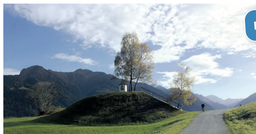
Unterwegs im Val Lumnezia

Und noch etwas Biblisches. In Mt 6,26 steht: «Schaut auf die Vögel des Himmels: Sie säen nicht, sie ernten nicht, sie sammeln nicht in Scheunen – euer himmlischer Vater ernährt sie. Seid ihr nicht mehr wert als sie?» Die Vögel werden in dieser Rede von Jesus als Beispiel für ein vertrauensvolles Leben dargestellt. Das Leben gedeiht (manchmal mehr, manchmal weniger), aber sicherlich auch ohne ständiges Sorgen. Diesen Aufruf, auf die Vögel zu schauen, werden wir in dieser Exkursion zum Greifensee praktisch umsetzen.