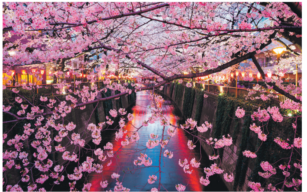
Kirschblüte in Japan