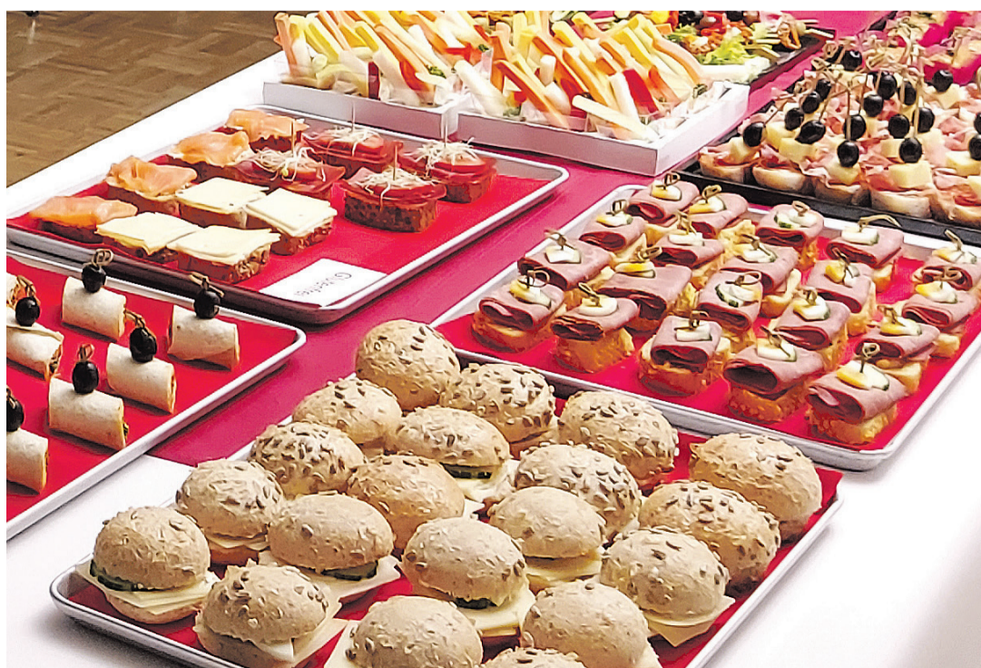
Aufnahmen vom letzten Anlass

Freitag, 3. November 2023, 18.00 Uhr, ReZ Dübendorf