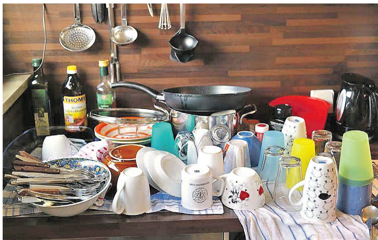
Im Subito Mittagstisch wartet eine Menge Arbeit – aber auch viel Freude, Spass, Genuss, Zufriedenheit und Lebensfreude.