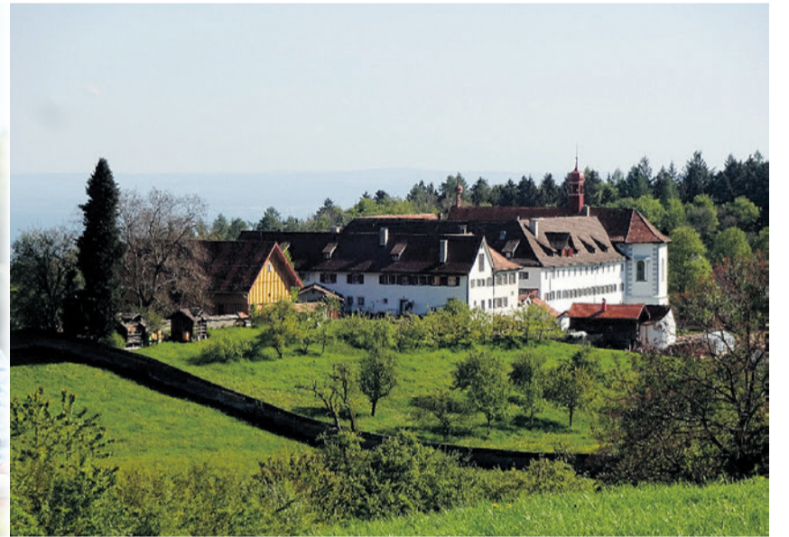
Kloster Notkersegg, St. Maria v. Guten Rat in St. Gallen