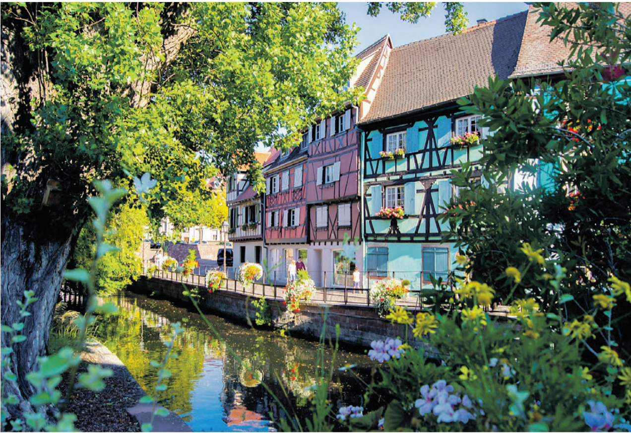
Colmar ist berühmt für ihr gut erhaltenes architektonisches Erbe aus sechs Jahrhunderten.