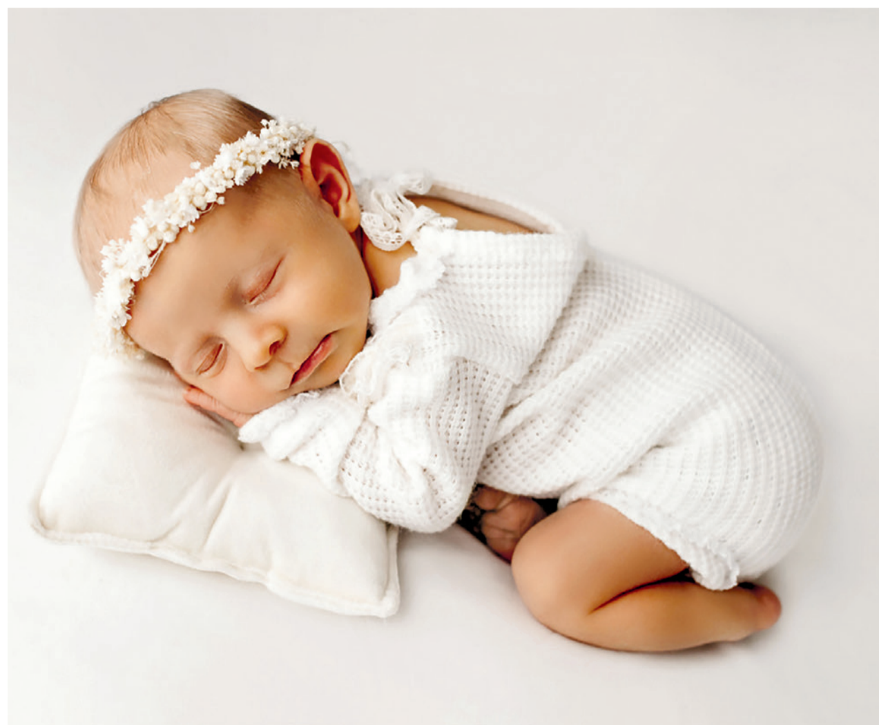
Wir sind ein ganz kleiner Teil der Schöpfung und gleichzeitig Ebenbild Gottes.

Ein zweiter Fragenkomplex fordert mich ebenso heraus: Wie stelle ich mich dar? Wie inszeniere ich mich? Bin ich jemand, der stän-