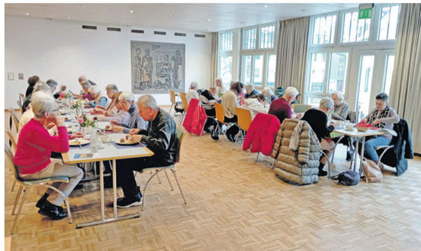
Gemütliches Zusammensein beim Zmittenand

Nach der Sommerpause findet das Zmittenand am 30.8. wieder statt. Die nächsten Daten sind der 13., der 20. und der 27. September. Thomas Wüest, Sozialdiakon