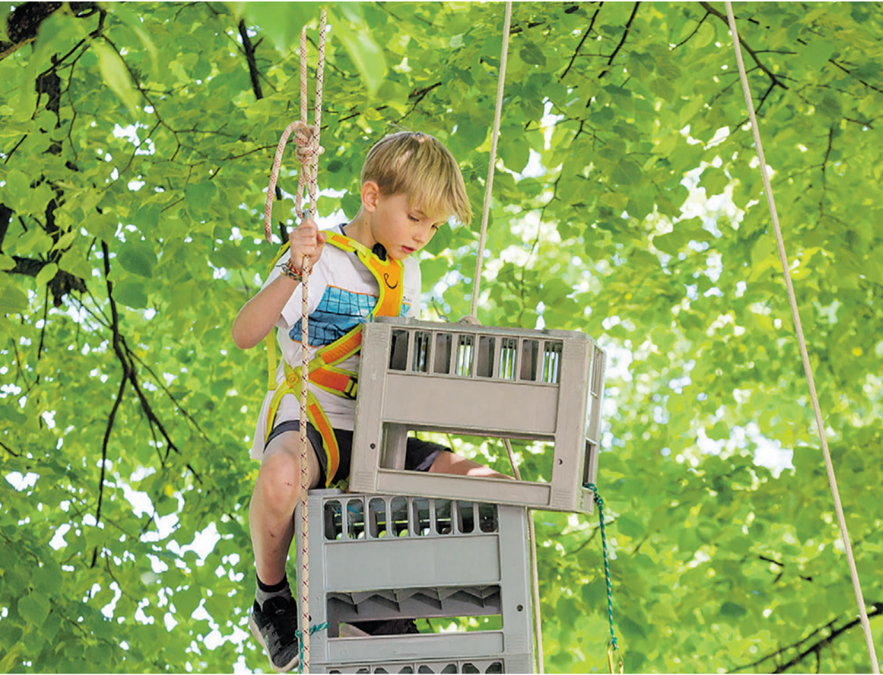
Harassen stapeln an der Chile Chilbi 2022