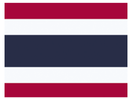
Flagge von Thailand

Die Flagge Thailands besteht aus Streifen in drei Farben. Rot steht