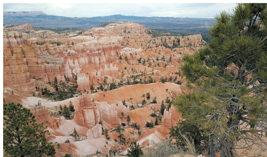
Beeindruckende Naturwunder der USA

Donnerstag, 19. September 2024, 14.00 Uhr, Pfarrhaussaal Schwerzenbach