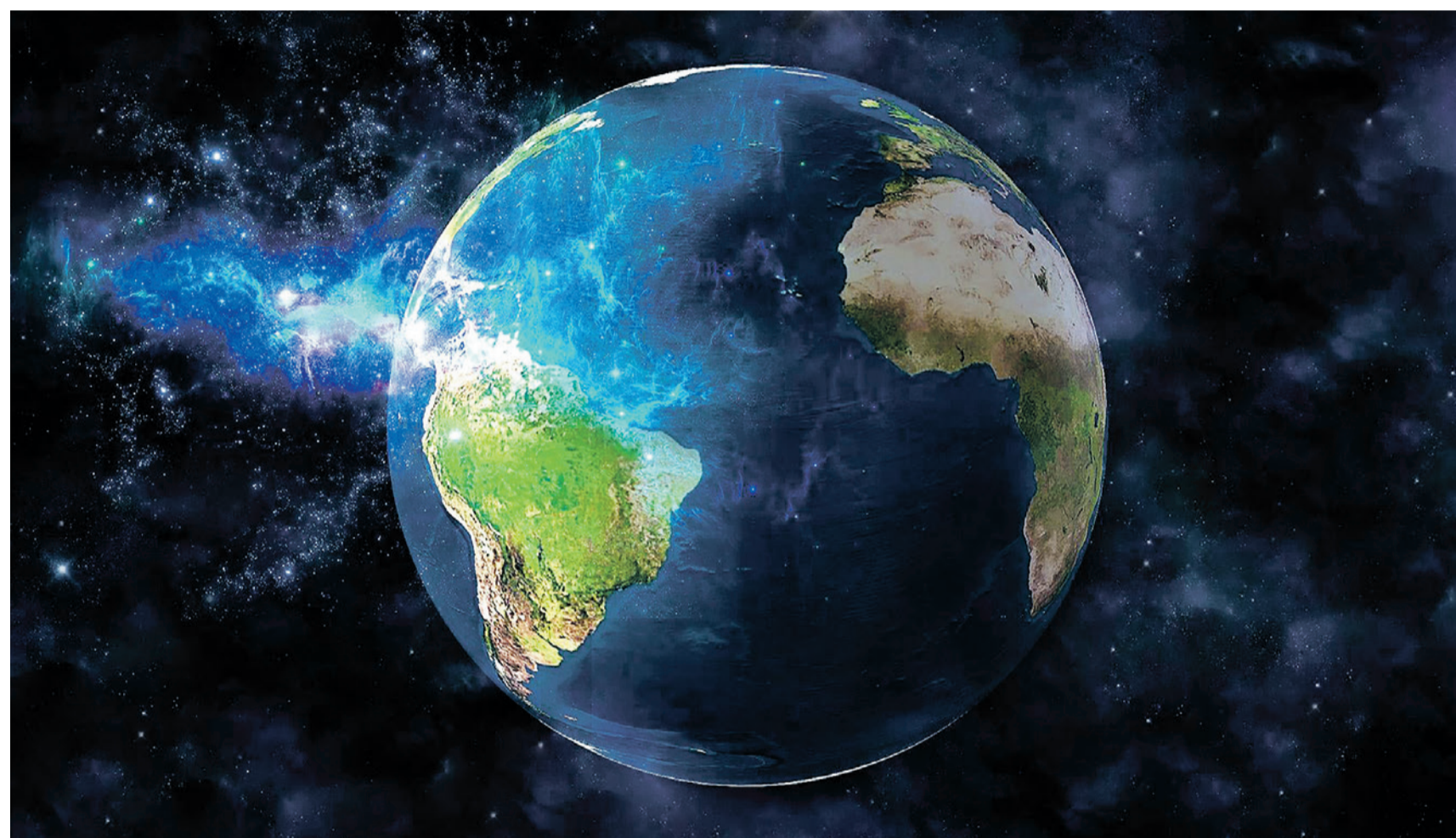
Der Blick in den Kosmos lässt mich demütig werden: diese endlose Weite, diese unglaubliche Schöpfung.

Nein, Sie haben recht, dieses Wort gibt es nicht. Es ist meine Schöpfung aus den zwei Begriffen Demut und De-motivation. Sie hängen für mich eng zusammen, auch wenn es keine offensichtliche direkte Verbindung zwischen ihnen gibt. Gerne erkläre ich Ihnen wieso.