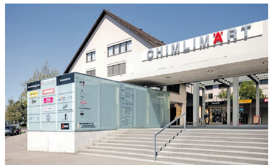
Gottesdienst im Chimlisaal