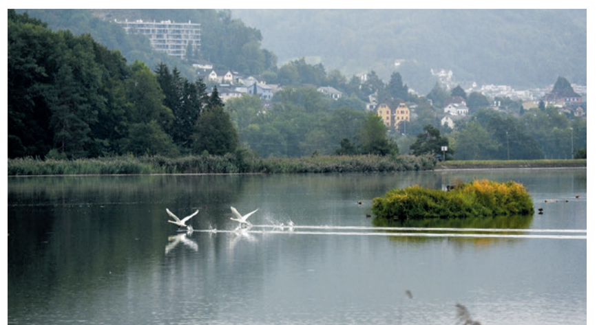
Zwei Schwäne heben ab, Klingnauer Stausee