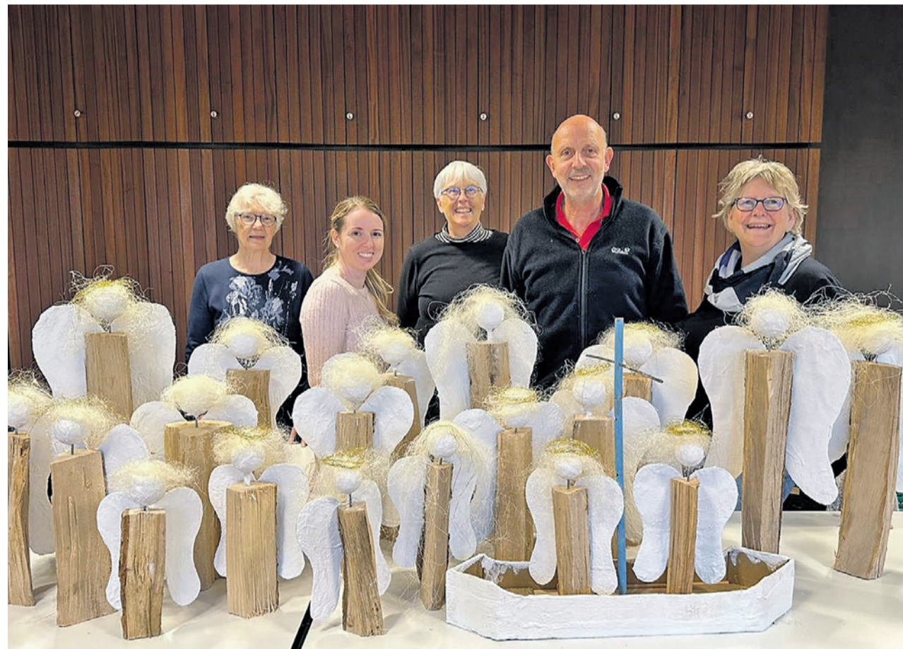
Selbstgebastelte Engel des Krippenfigurenteam

Ein hoffnungsvolles Scheitern Mit der Kirche ist eine Bewegung der Hoffnung entstanden, die nicht ans Scheitern glaubt. Die vielmehr aus der Auferstehungskraft das