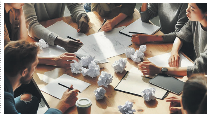
Nicht alle Projekte werden verwirklicht, manche scheitern

Mittwoch, 6. November 2024, 14.00–16.00 Uhr, ReZ Dübendorf