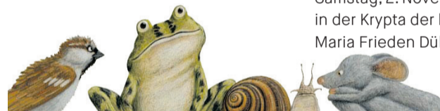
© Lorenz Pauli Kathrin Schärer, Atlantisverlag

Samstag, 2. November 2024, 10.30 Uhr in der Krypta der katholischen Kirche Maria Frieden Dübendorf