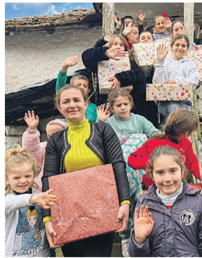
Lachende Kinder in Albanien