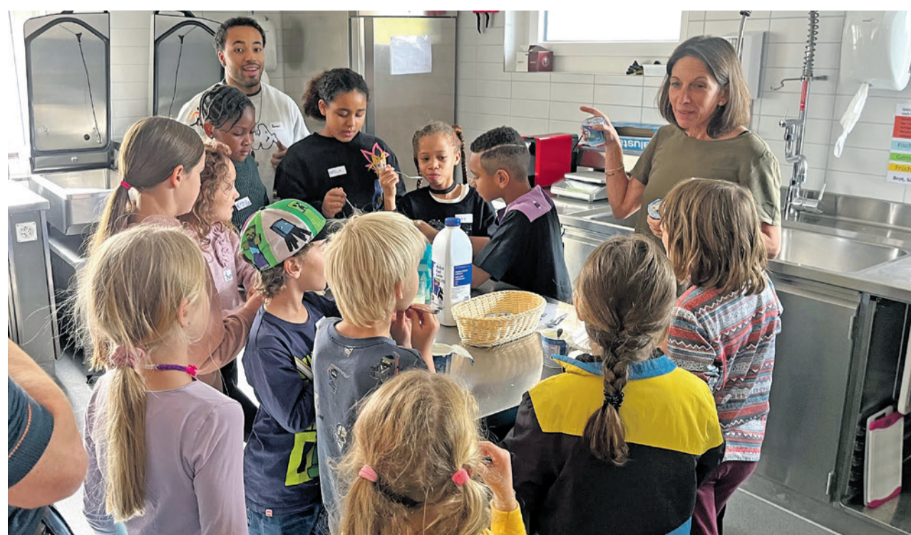
Erntedank-Festival am 29. September – Workshop Foodwaste und Haltbarkeit