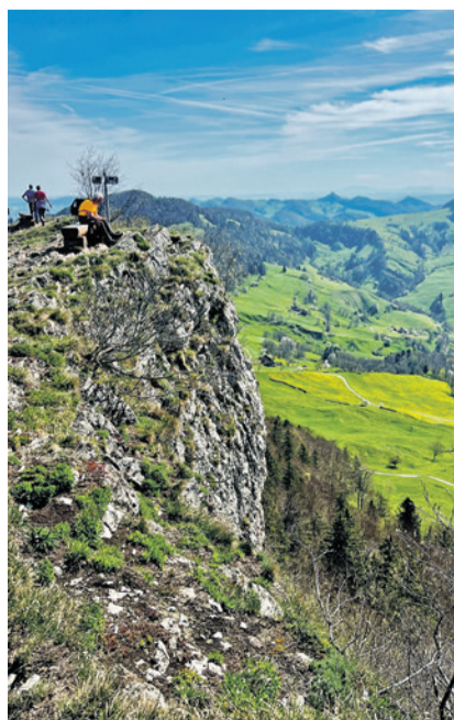
Schöne Landschaften laden zum Wandern und Radfahren ein

Im Frühtau zu Berge wir ziehen, fallera Es grünen die Wälder und Höhen, fallera Wir wandern ohne Sorgen Singend in den Morgen Noch ehe im Tale die Hähne krähen!