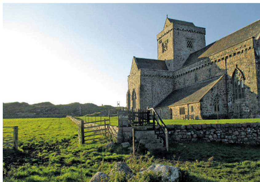
Kloster vor Sonnenuntergang auf der Hebrideninsel Iona

Donnerstag, 7. November 2024, 19.00 Uhr, Lazariterkirche Gfenn