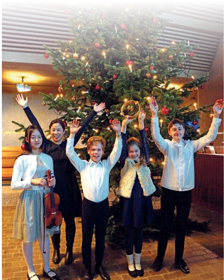
Junge fröhliche Musikanten