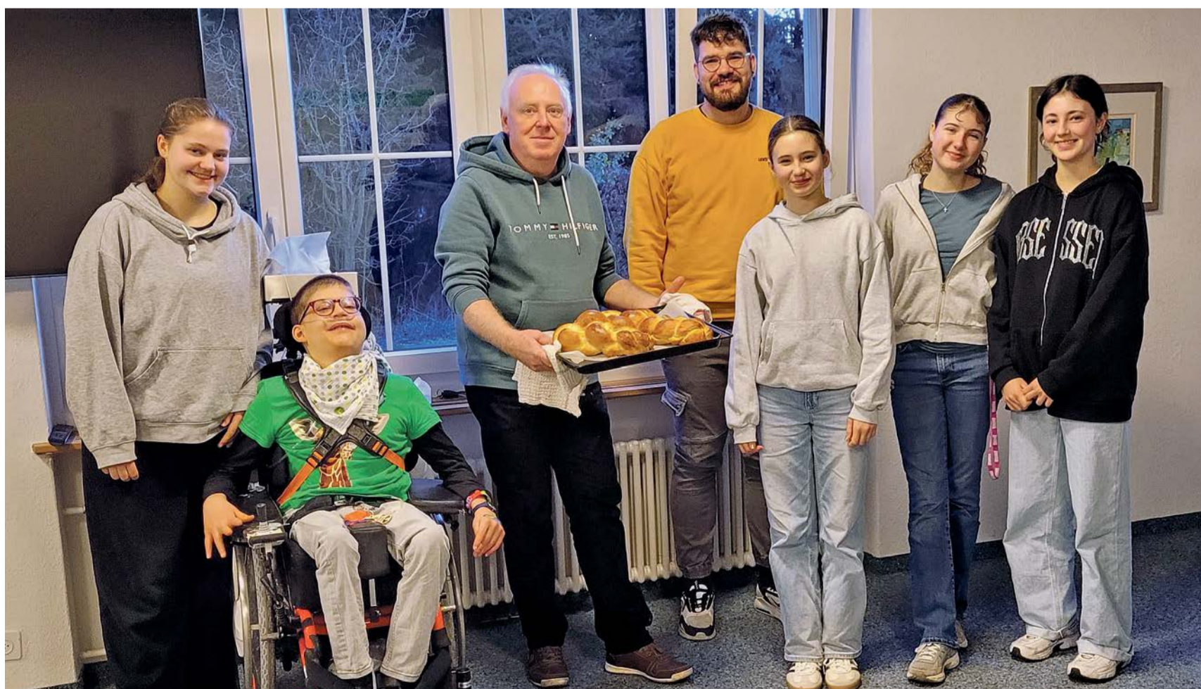
Die Konfgruppe in Schwerzenbach am Hefezopf-Samstag. Am Abend kamen die Eltern zum Apéro. Brot spielt eine zentrale Rolle in der Bibel und steht bis heute für Gemeinschaft.