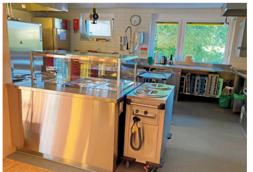
Piazzasaal und Küche