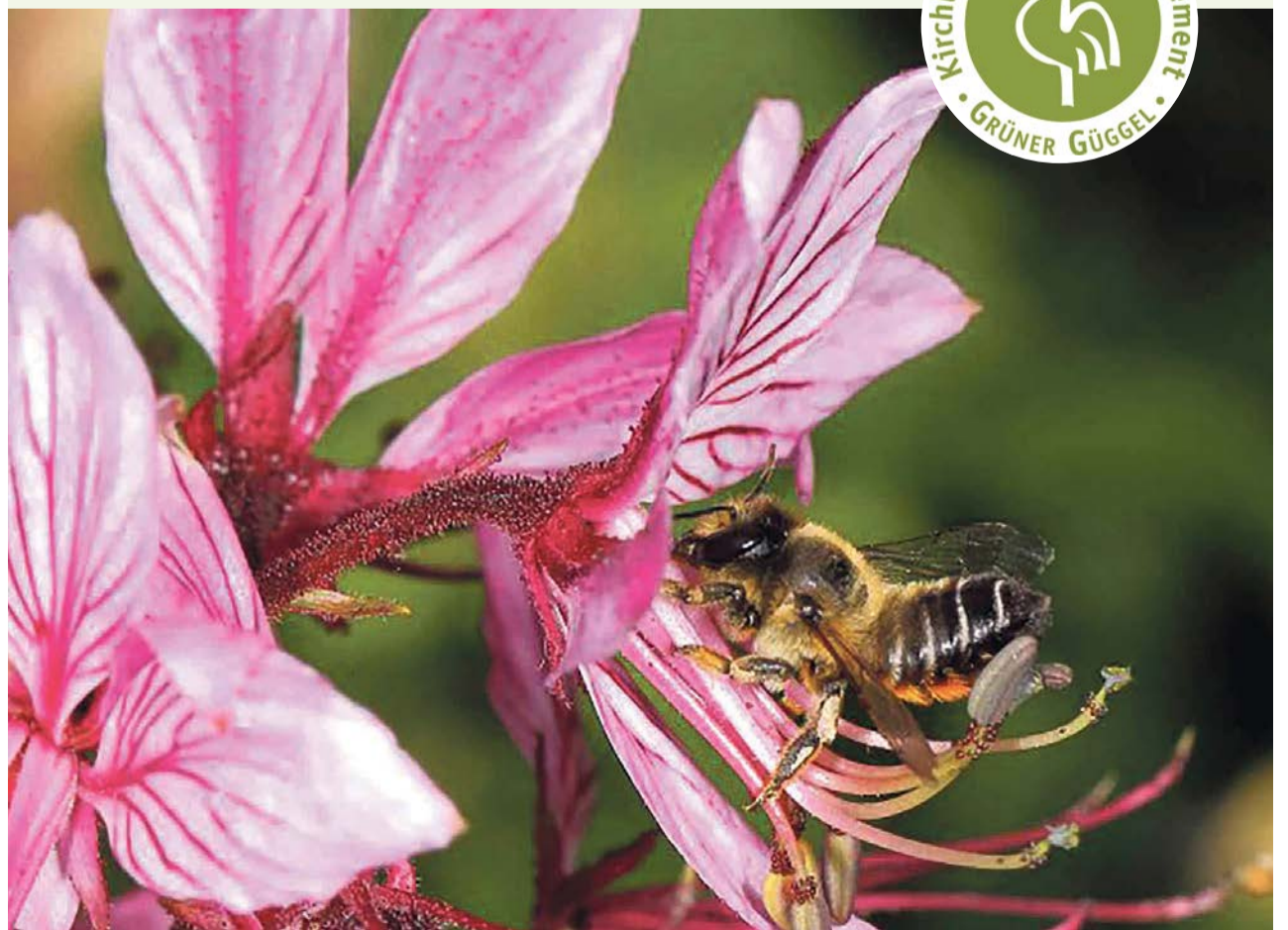
Wildbiene des Jahres 2025 ist die Garten-Blattschneiderbiene