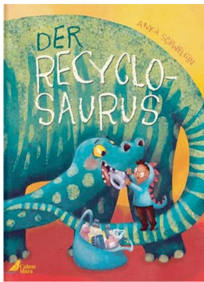
Der Recyclosaurus, Anka Schwelgin, CalmeMara Verlag, 2. Aufl. 2024

Die tollen Bilder animieren zu Gesprächen über Dinos, Erdöl und Umweltschutz. Warum Plastik ein Problem für die Umwelt ist und was wir dagegen tun können, endet mit der Frage an jede und jeden von