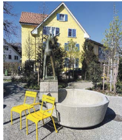
Brunnen beim Lindenplatz – aber noch ohne Wasser

Freitag, 23. Mai 2025, 18.30 Uhr, Treffpunkt vor Stadthaus Dübendorf