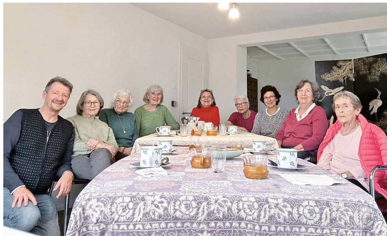
Der Besuchskreis Birchlen grüsst freundlich.