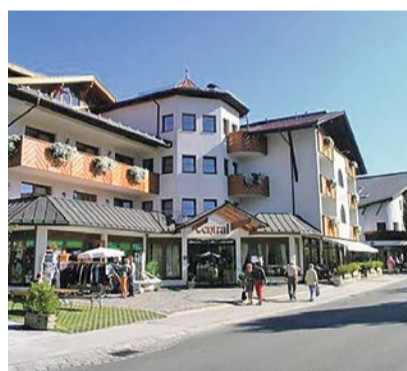
Hotel Central in Seefeld