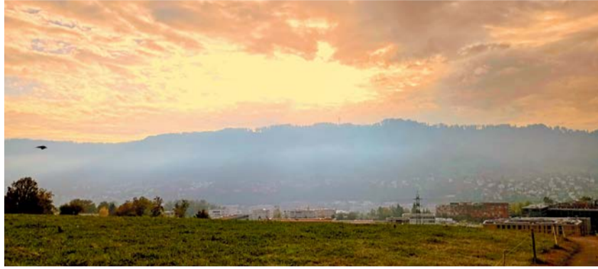
Ausblick von Kilchberg ins Sihltal

Vom Stockengut führt der Wanderweg an Weiden und Wiesen vorbei auf eine Anhöhe mit Blick auf den gegenüberliegenden Uetliberg und die Stadt Zürich. Von dort geht es hinab zum Spital Kilchberg