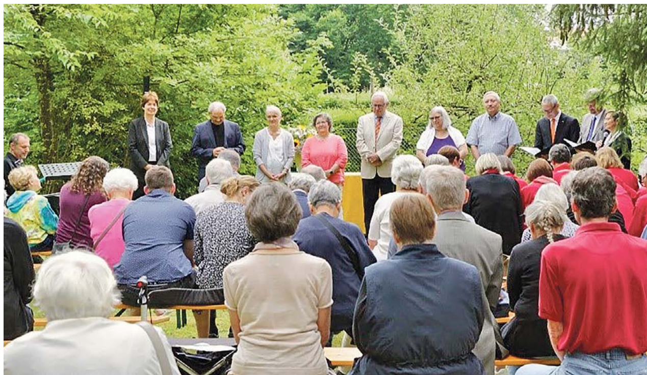
Einsetzung der Kirchenpflege im Gottesdienst zum Kirchenjubiläum 2022