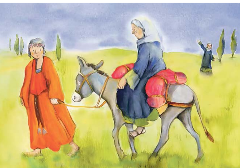
© Susanne Brandt, Petra Lefin, Ruth und Noomi fangen neu an, Don Bosco Verlag, 2024

Beim Fiire mit de Chliine tauchen wir in die magische Kinderwelt ein,