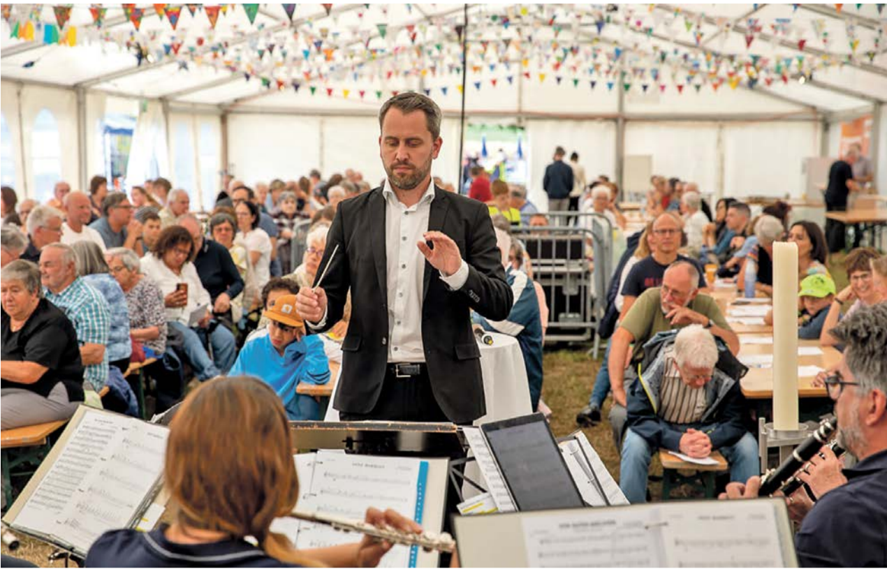
Musikgesellschaft im Festzelt beim Dorffest Schwerzenbach 2023