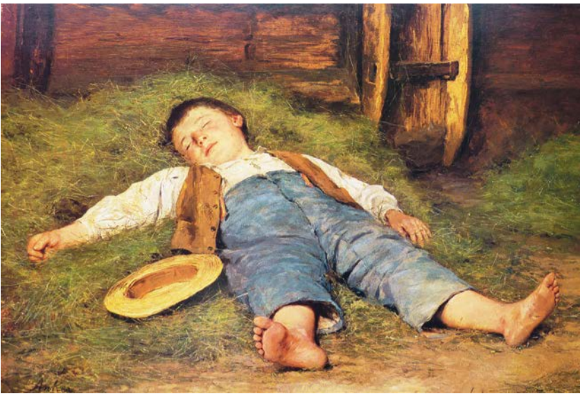
«Knabe im Heu» von Albert Anker, lizenzfrei