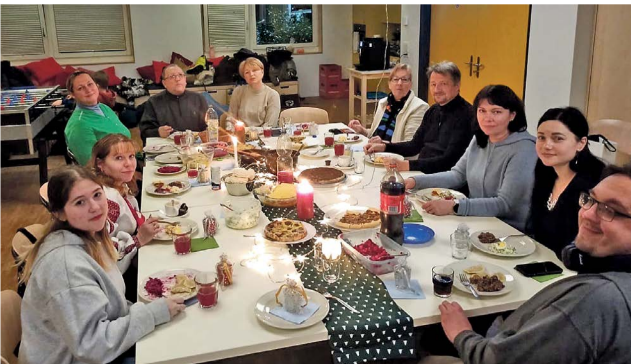
Weihnachtsschmaus im Treffpunkt Ukraine mit ukrainischen Spezialitäten