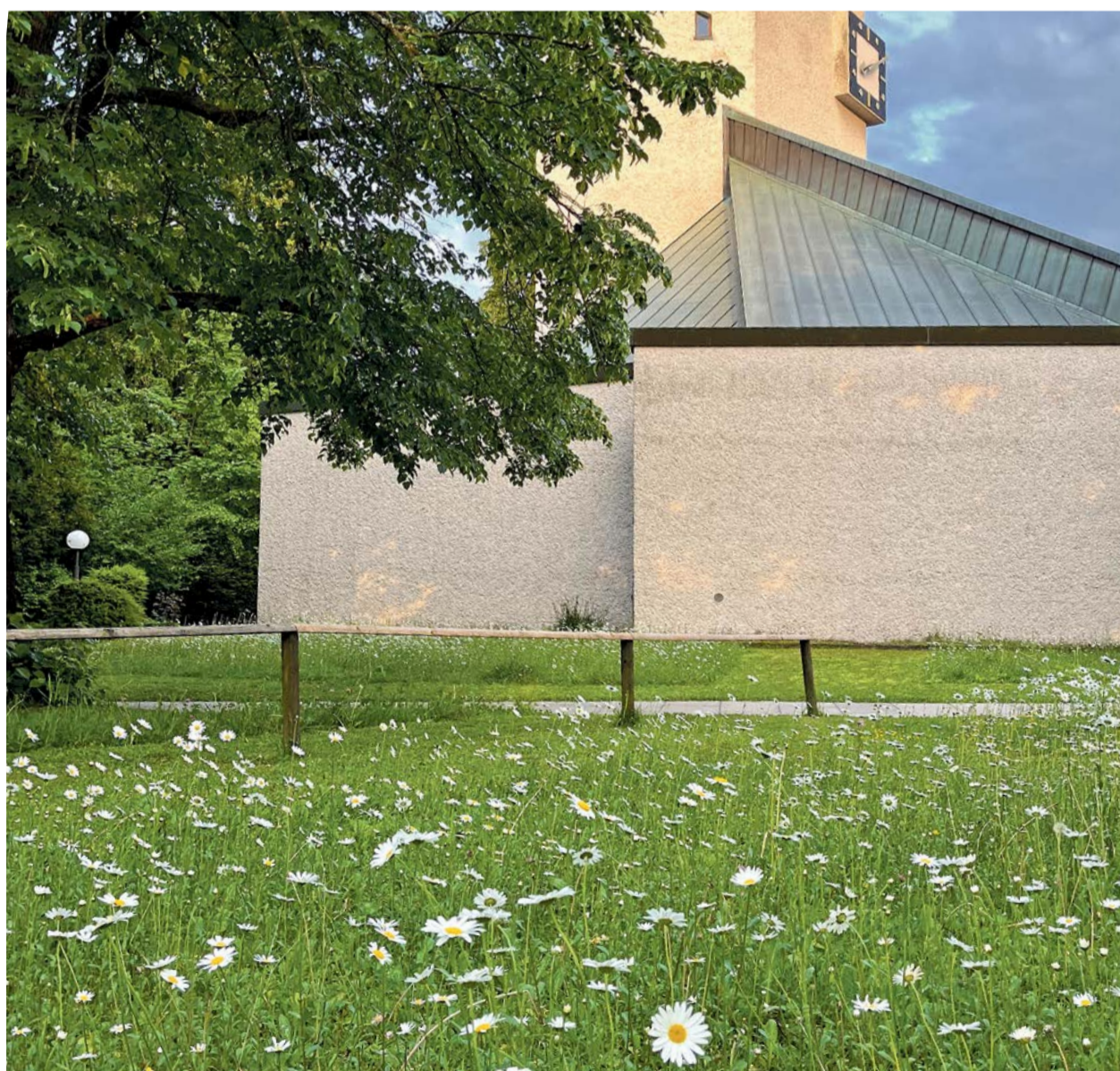
Schön gemacht, die Blumenwiese vor der Kirche im Wil.