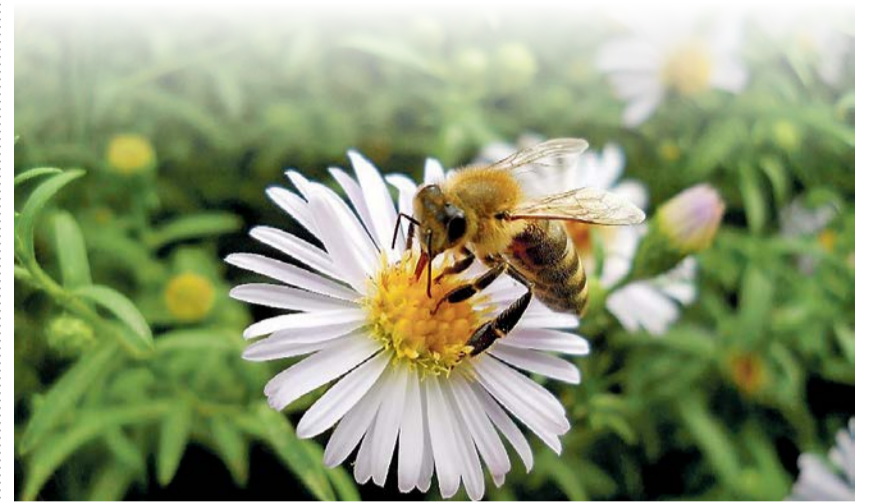
Honigbiene bei der Arbeit

Donnerstag, 5. Juni 2025, 9.00 Uhr, Pfarreizentrum Leepünt