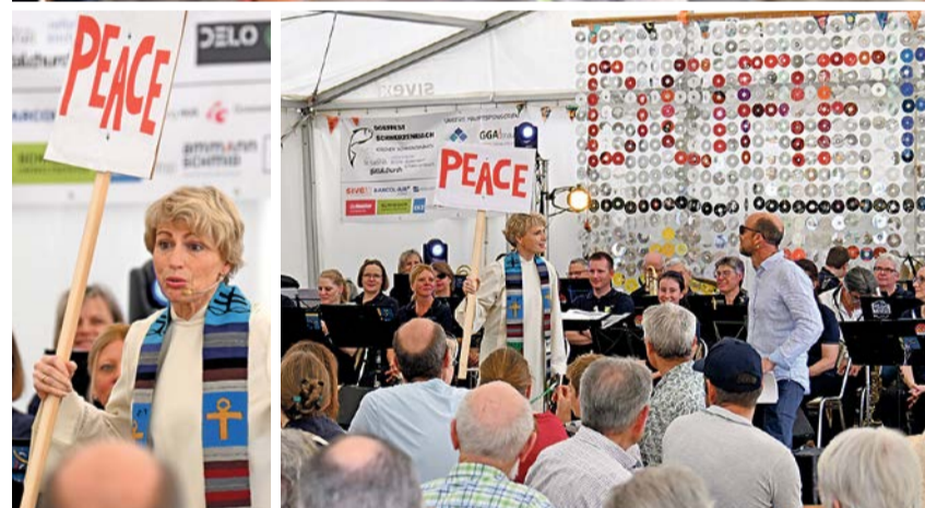
Impressionen vom Gottesdienst beim Dorffest.