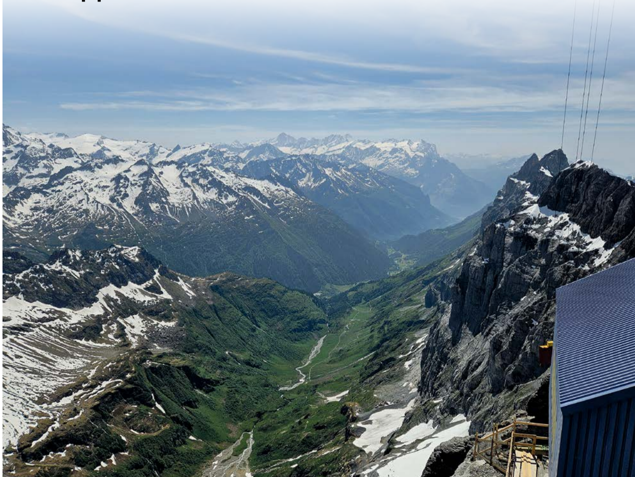
Aussicht von der Titlis-Bergstation anlässlich des Personalausflugs unserer Kirchgemeinde.