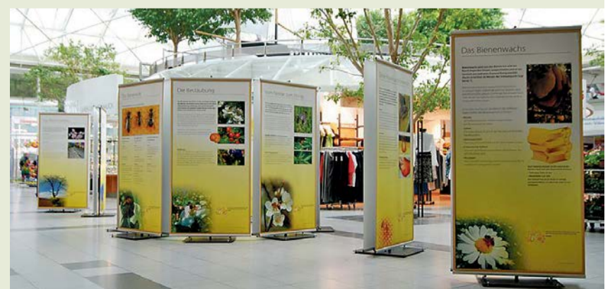
Wanderausstellung von BienenSchweiz