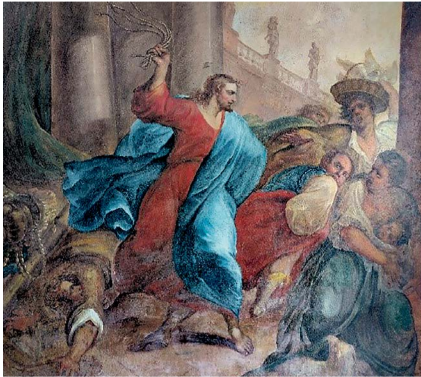
Gemälde im Eingangsbereich des Klosters Engelberg

Dieses Jesusbild zu Beginn des Johannesevangeliums entspricht nicht der Vorstellung vom sanftmütigen Herrn. Seine Botschaft jedoch ist eindeutig: Glaube und Spiritualität dürfen nicht dem Kommerz geopfert werden. Es braucht eine radikale Trennung. Der Tempel – wie auch jede Kirche – soll ein heiliger Ort des Gebets und der inneren Sammlung sein und bleiben.