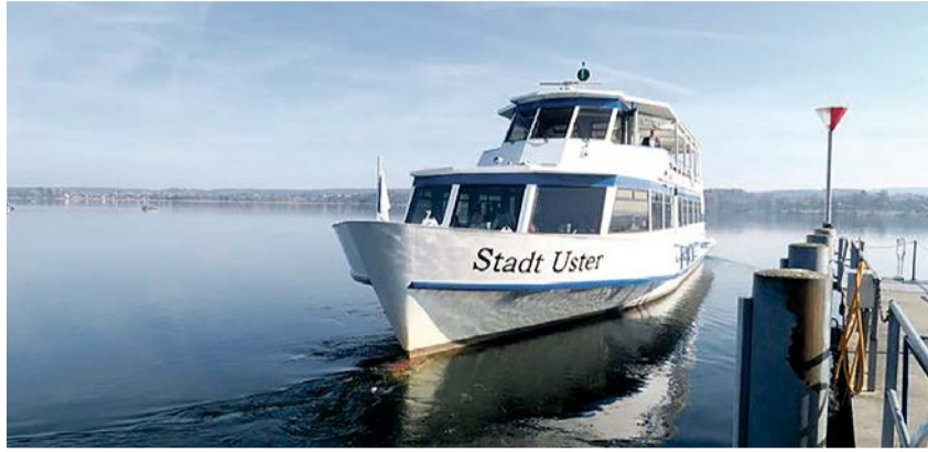
Das MS Stadt Uster steht am Schiffsteg in Maur ab 10.15 Uhr bereit.

Anreise von Schwerzenbach: Bus 704 ab Bahnhof 9.49 Uhr, umsteigen Fällanden Gemeindehaus auf Bus 743.