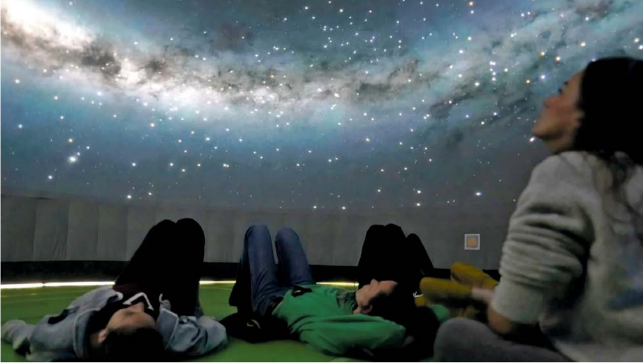
360-Grad-Projektionen von Sternen, Planeten und Galaxien