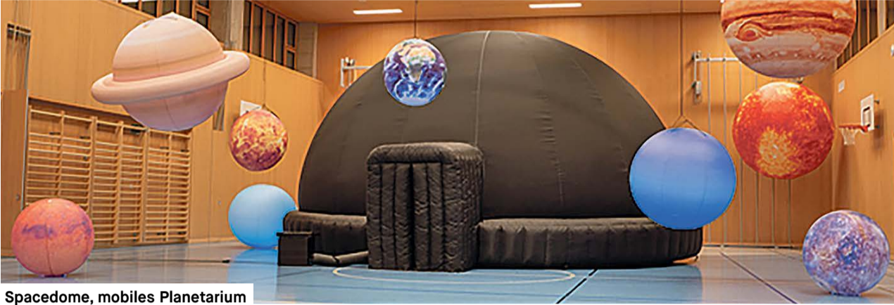
Spacedome, mobiles Planetarium