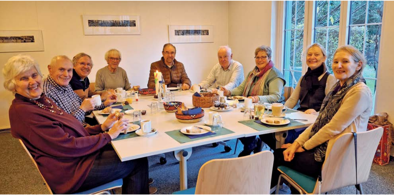
Gemütlicher Zmorge nach dem Morgengebet im Pfarrhaussaal