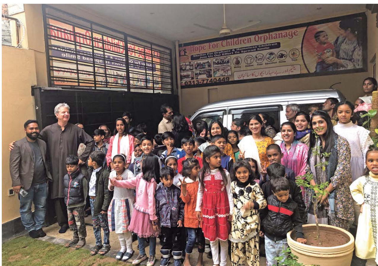
Kinder des Kinderheims in Islamabad mit der neuen Ambulanz

Sonntag, 2. Februar 2025, 10.30 Uhr, ReZ Dübendorf