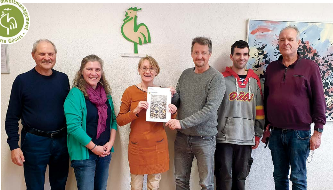
Umweltteam von Dübendorf-Schwerzenbach