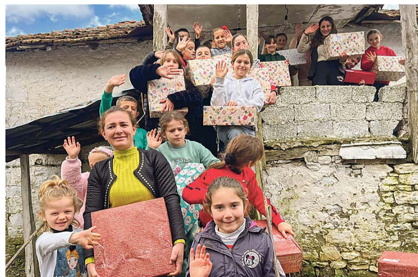
Lachende Kinder in Albanien