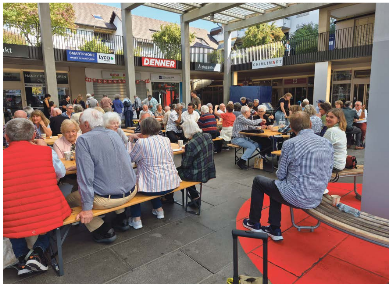
Festwirtschaft im Chimlimärt nach dem ökumenischen Betttagsgottesdienst im Chimlisaal.