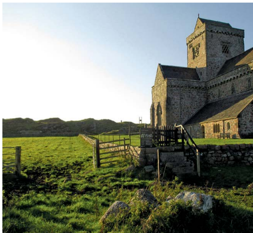
Kloster vor Sonnenuntergang auf der Hebrideninsel Iona

Donnerstag, 5. November 2025, 19.00 Uhr, Lazariterkirche Gfenn