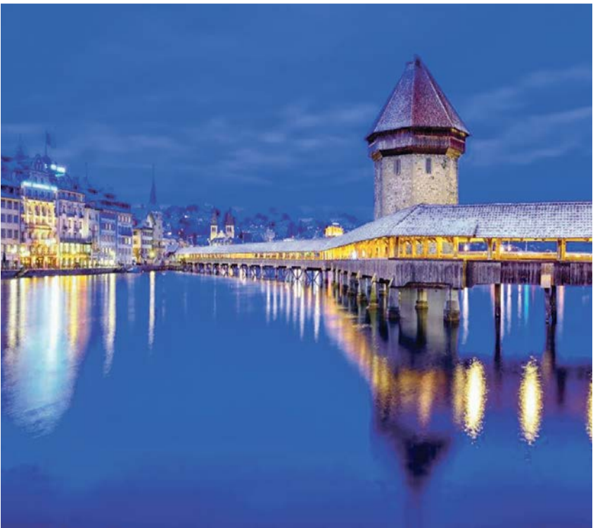
Die Kapellbrücke ist die älteste und die zweitlängste überdachte Holzbrücke Europas und verbindet die durch die Reuss getrennte Alt- und Neustadt von Luzern.