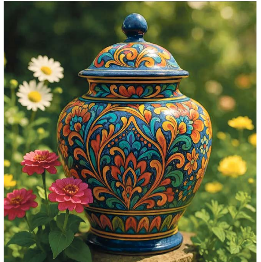
Selbst gestaltete Urne

Unser Sozialdiakon Thomas Wüest geht noch einen Schritt weiter. Er bietet einen Kurs an, in dem die Teilnehmenden ihre ganz individuelle Urne gestalten können. Das Gestalten der Urnen ist aber nur ein Aspekt des Kurses. Es geht zunächst um die Auseinandersetzung mit der eigenen Sterblichkeit. Damit verbunden die Frage: Was sind meine diesbezüglichen Werte? Möchte ich in Erinnerung bleiben? Und wenn ja: Wie? Anregungen dazu bieten ein Rundgang durch den grössten Friedhof der Stadt Zürich im Sihlfeld, ein theologischer Input und natürlich viele Gesprächsmöglichkeiten. Im Anschluss be-