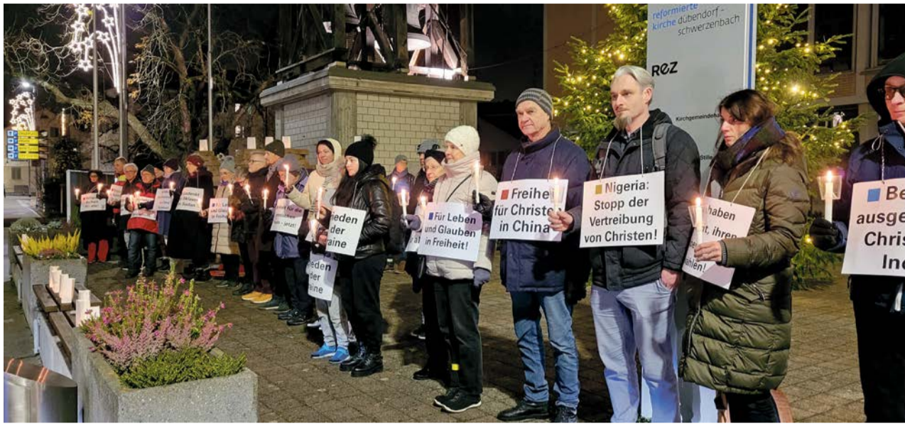
An der Mahnwache im vergangenen Jahr standen Freiwillige aus den reformierten, katholischen und Freikirchen in Dübendorf und Schwerzenbach für Menschen ein, die besonders um die Weihnachtszeit wegen ihres Glaubens bedroht werden.