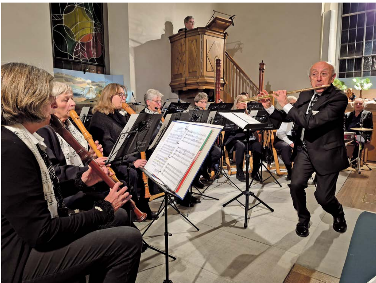
Das Flötenensemble in vollem Einsatz