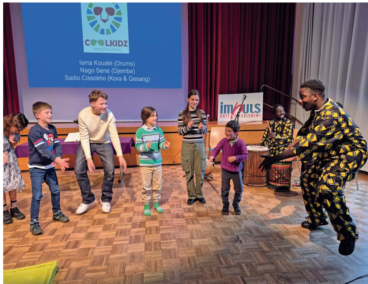
Im Impuls-Gottesdienst am 7. Dezember 2025 begeisterte die senegalesische Band Coolkidz und animierte nicht nur die Kinder zum Tanz.