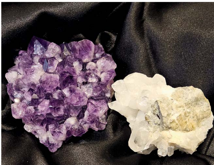
Amethyst und Bergkristall