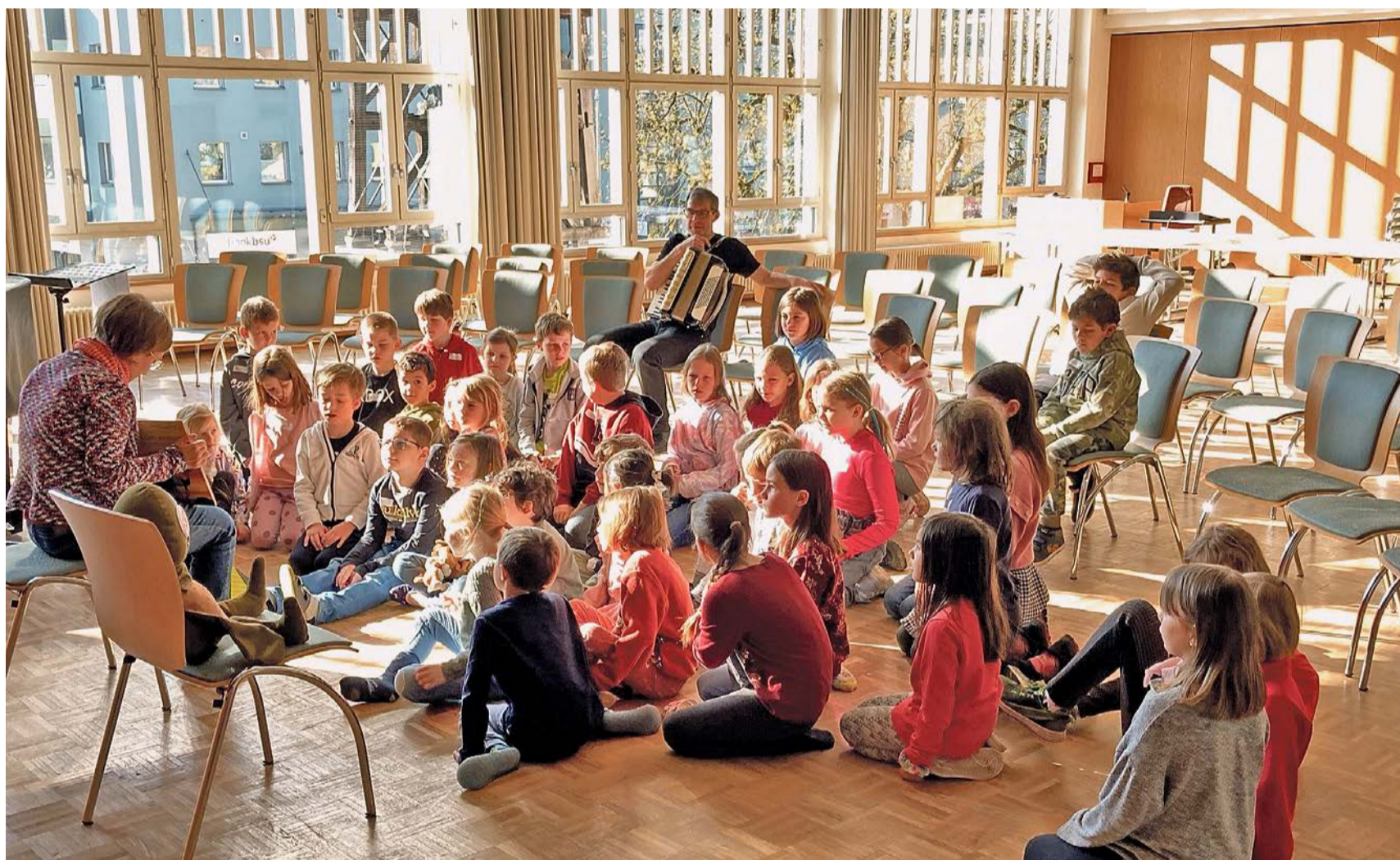
Kiki-Tag am Gründonnerstag

Von Weihnachten zu erzählen, fällt vielen leicht. Es ist das grosse Fest der Geburt Jesu: Gott wird Mensch und kommt in die Welt. Die Geschichte können Kinder gut verstehen – ein Kind in der Krippe, Menschen, die staunen und die Freude über neues Leben.