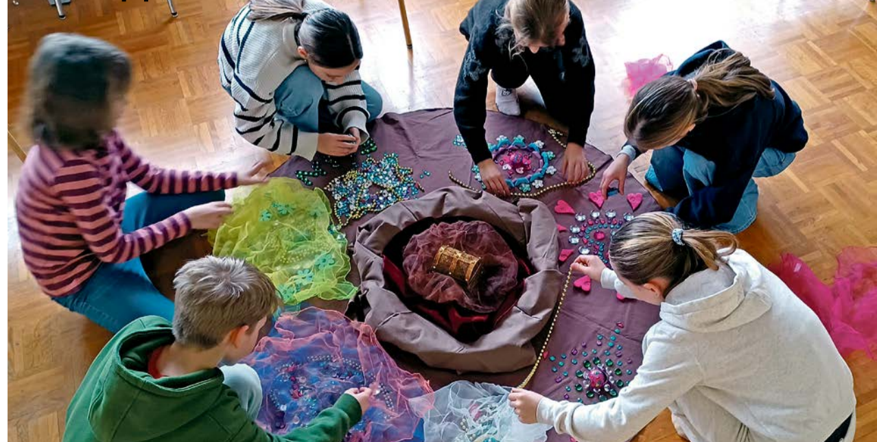
Schnappschuss vom Unti: das Reich Gottes ist wie ein verborgener Schatz