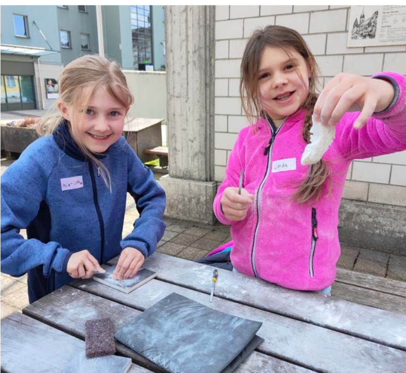
Mädels beim Specksteinschleifen