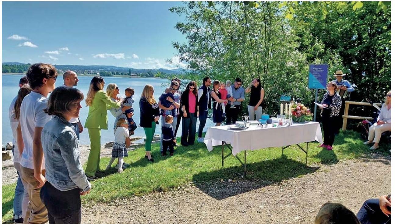
Tauffeier am Greifensee