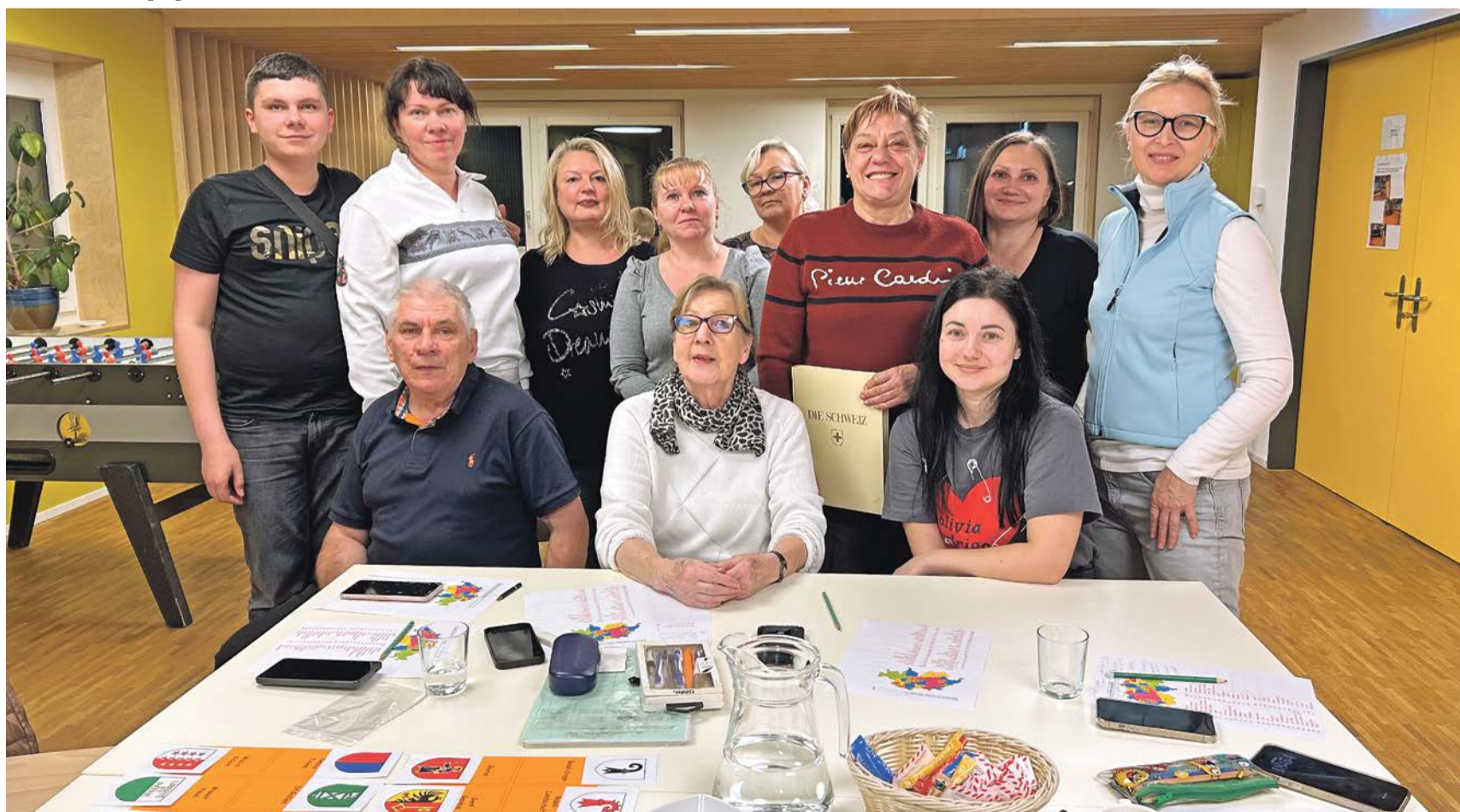
Staatskunde mit Kantone raten im Treffpunkt Ukraine