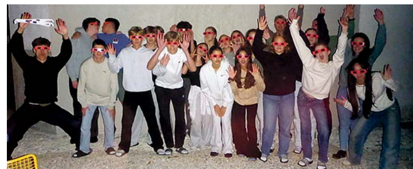
Foto aus dem Konflager, Oktober 2025