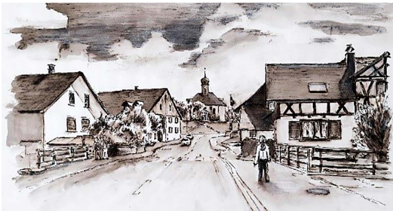
Tuschzeichnung mit Kirche Schwerzenbach