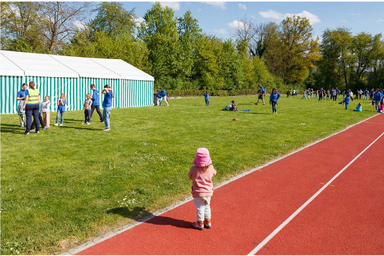
Klein und Gross hatten viel Spass auf der Sportanlage Eichstock