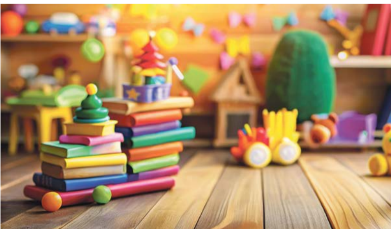
© Margot Kässmann, Stefanie Scharnberg, Wie Gott die Welt erschuf, bene!, 2023.

Eine ökumenische Feier von ca. 40 Minuten für alle Kinder bis ca. 7 Jahre, in Begleitung ihrer Eltern, Grosseltern, Gotte und Götti.