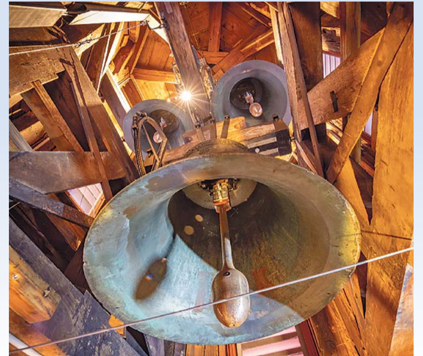
Glocken Kirche Schwerzenbach