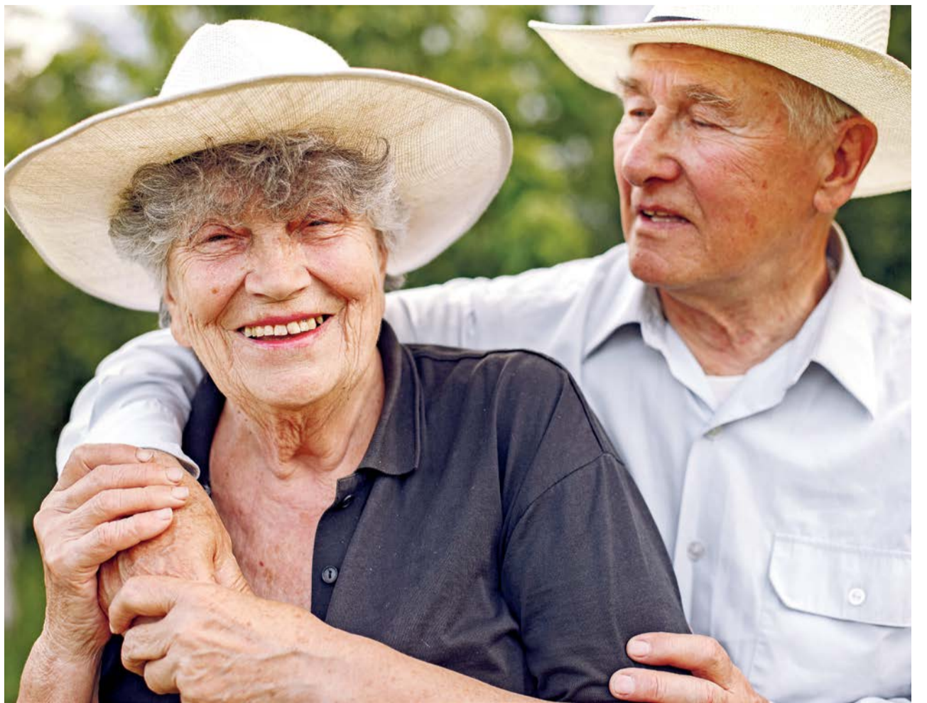
Zufriedenheit ist nicht Schicksal