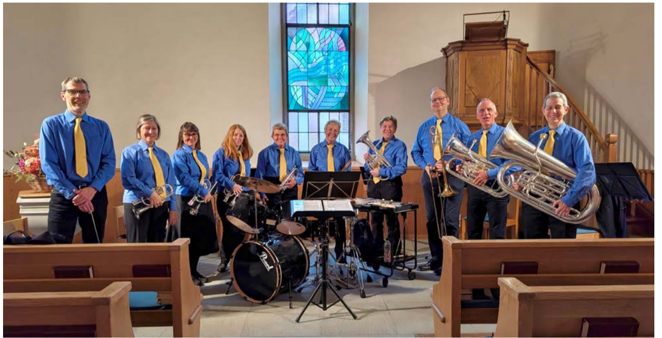
Brassband in der Kirche Schwerzenbach