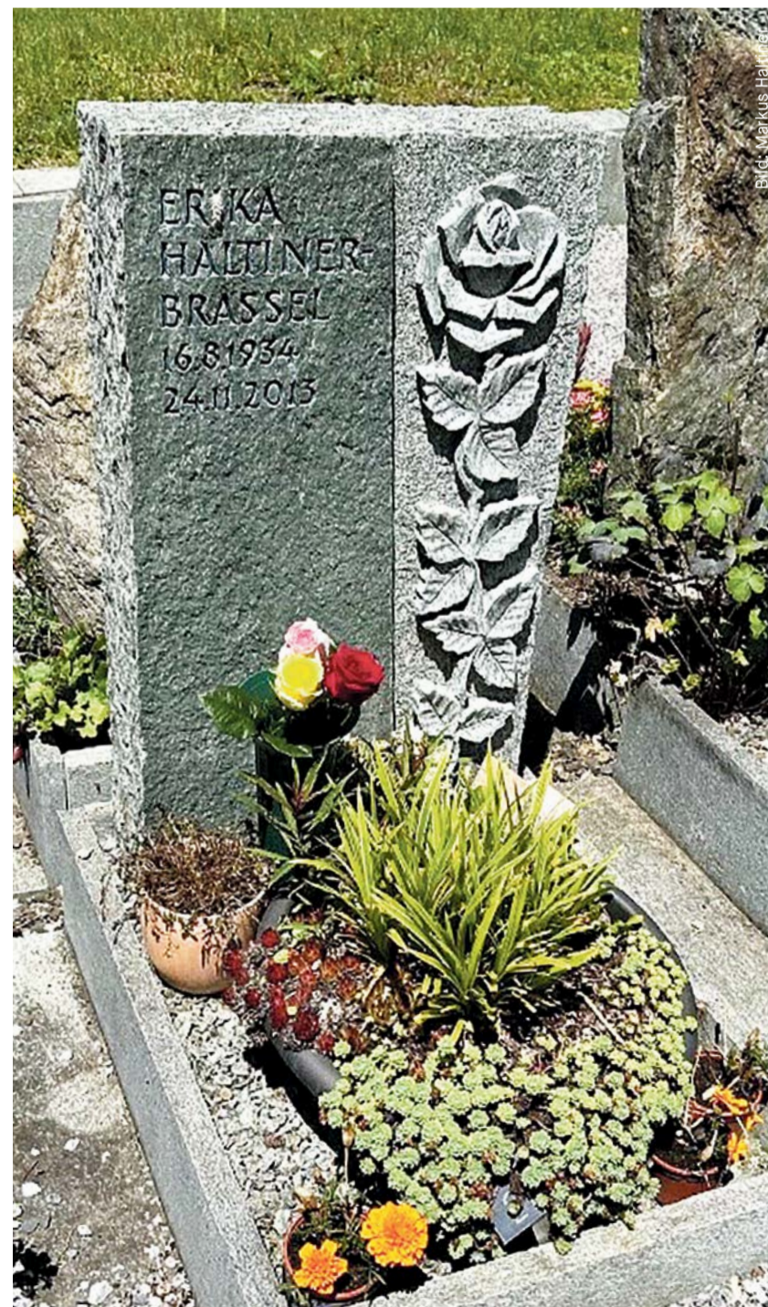
Grabstein an Urnengrab in naturbelassenem Granit mit Rosenmotiv

«Die Herkunft der verwendeten Natursteine, kurze Transportwege und faire Arbeitsbedingungen bei der Gewinnung werden stärker beachtet.»