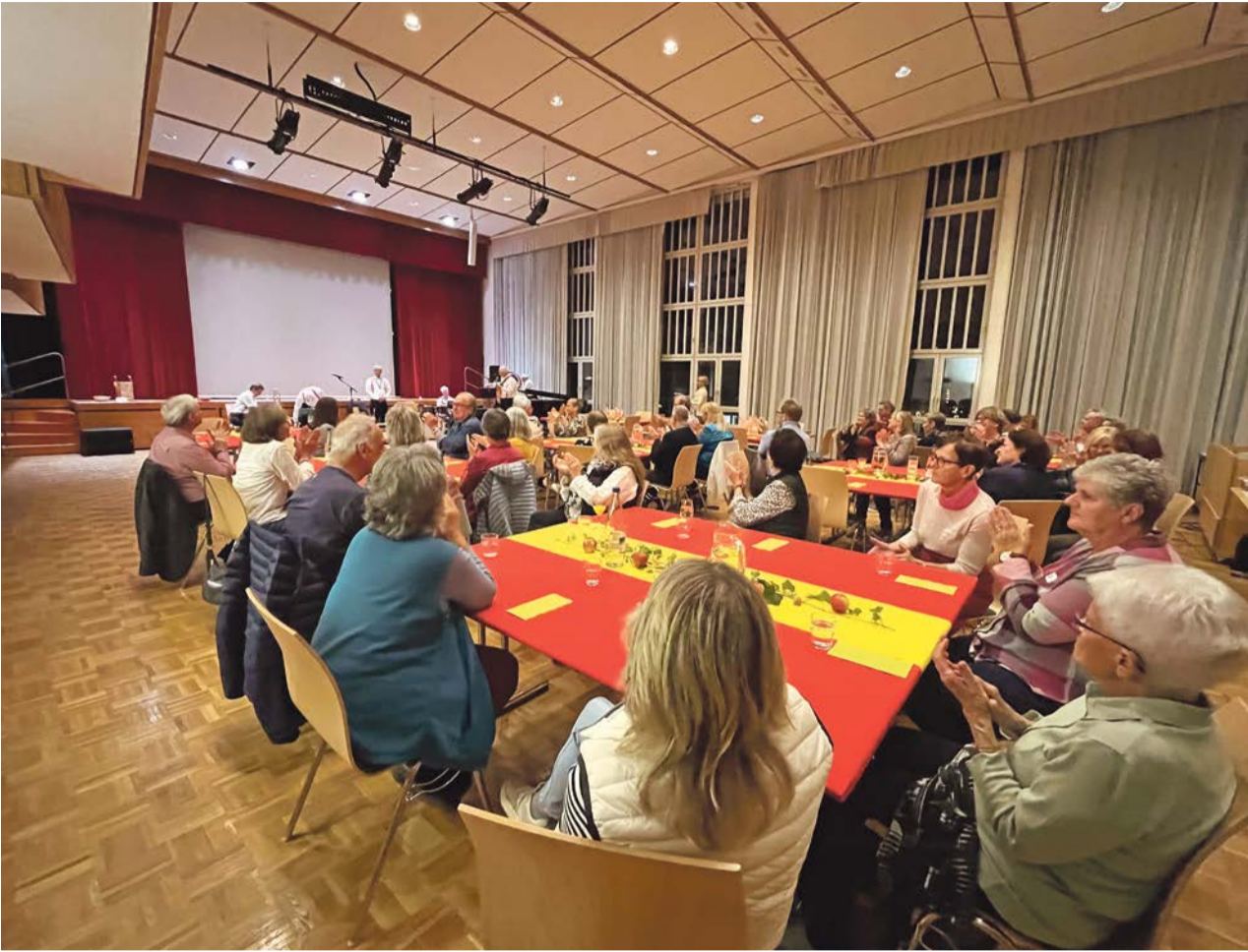
Neulandfeier im ReZ Dübendorf