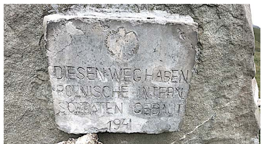
Markierungsstein am Polenweg

Donnerstag, 16. Juli 2026, 14.00 Uhr, Pfarrhaussaal Schwerzenbach