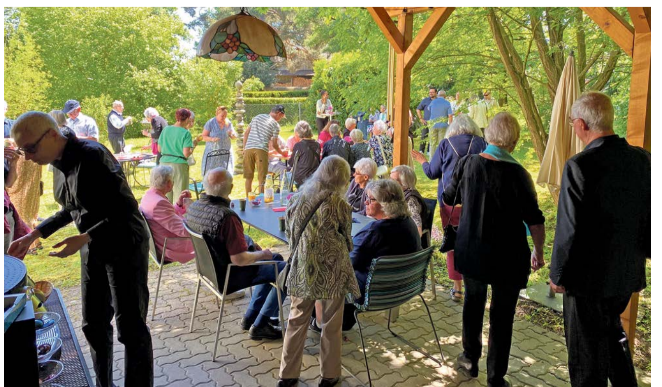
Kirchenkaffee an Pfingsten, 24. Mai 2026, im Pfarrhausgarten in Dübendorf