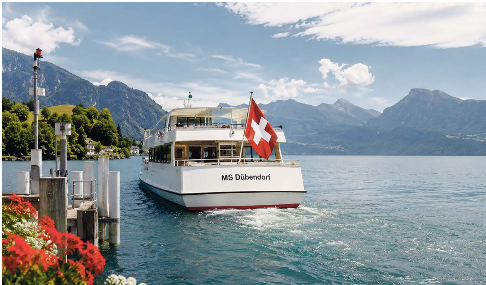
Zusammen mit zwei weiteren Mitgliedern der bisherigen Mannschaft winke nun auch ich den Abfahrenden nach und wünsche allen Passagieren und dem neuen Kapitän viele wirklich gute und schöne Reisen.

In wenigen Tagen geht eine weitere Legislatur in unserer Kirchgemeinde Dübendorf-Schwerzenbach zu Ende. Die Wahlen sind bereits wieder Geschichte und das Team der Kirchenpflege tritt in leicht veränderter Form zu den nächsten Etappen an. Zeit also, kurz durchzuatmen um wieder Kräfte zu sammeln. Eine solche Rast, oder nennen wir es ganz einfach ein Verpflegungshalt, bietet zudem die Chance, sich das Vergangene noch einmal durch den Kopf gehen zu lassen. Damit verbunden sind natürlich auch die Vorfreuden auf das Kommende.